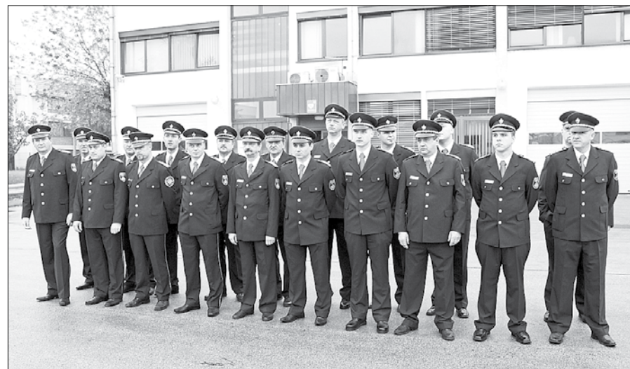
Člani PGE Gorenje ob 40-letnici uspešnega delovanja

V kroniki 40 let Poklicne gasilske enote Gorenje niso pozabili na velike požare v lakirnici