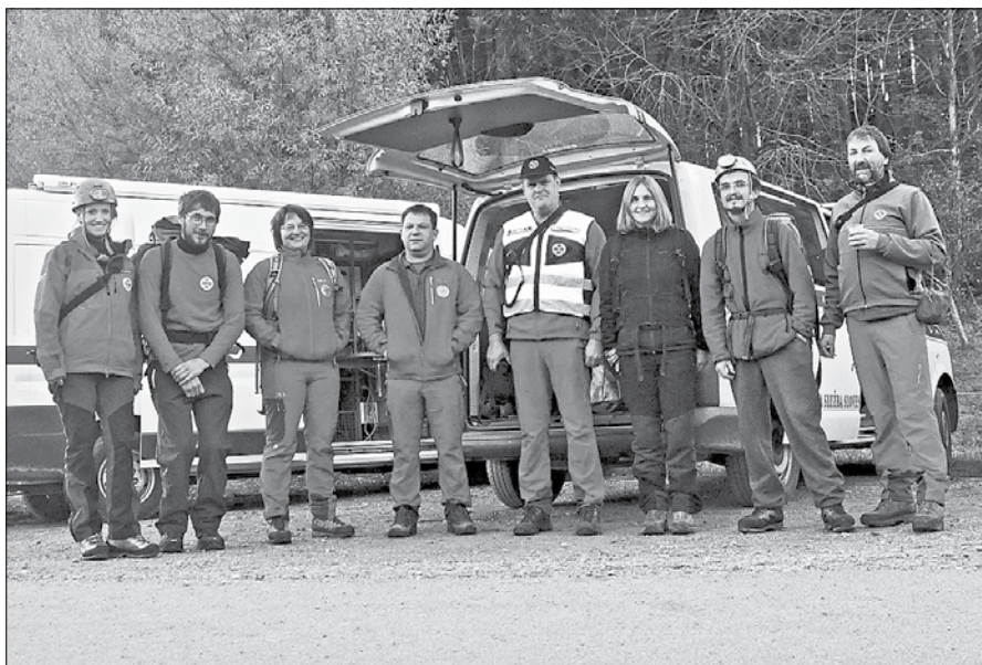
Člani gorske in jamarske reševalne službe so prečesali zahtevnejše predele na območju Smrekovca.