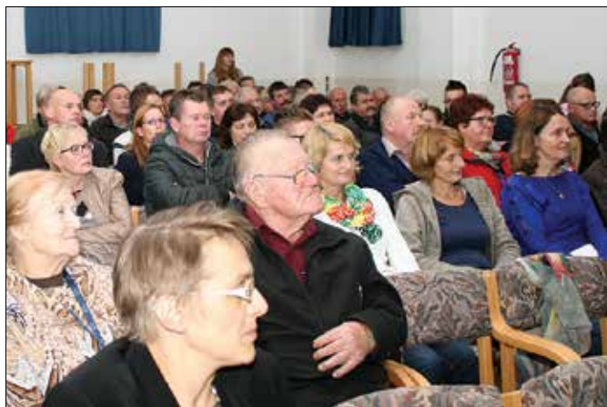
Obiskovalci so napolnili kulturno dvorano v Lučah do zadnjega kotička.