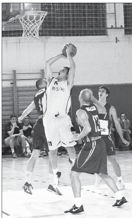
Nazarski košarkarji so v napadu prikazali hitro in raznovrstno igro.

Domači košarkarji so odigrali vrhunskih 30 minut, v katerih so prevladovali na igrišču in do-