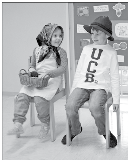
Učenci so z igro, pesmijo in besedami predstavili peso.

Po tako podrobni predstavitvi pese je potekal kviz, na katerem so si starši in drugi obiskovalci lahko prislužili nagrado s pravilnim odgovorom na vprašanja. Najlepši del je sledil ob pokušini jedi iz pese. Ne boste verjeli, pridne mamice so pripravile številne jedi, ki so vključevale peso, od torte, kolačkov, rižote, čipsa, kruha do pice. Slastne jedi in pesin sok so navdušile vse prisotne.