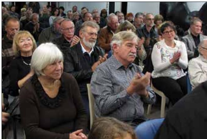
Številni navzoči so dobili oris spominskega zapisa o dogajanjih pred sedmimi desetletji.

govor o piscu in njegovem delu. Skupaj sta poslušalcem razkrila delčke zgodb iz knjige in Savodnikovega življenja. Dragoceno pričevanje takrat 8, 9, 10-letnega otroka je fragmentalno pisanje vojnih trenutkov.