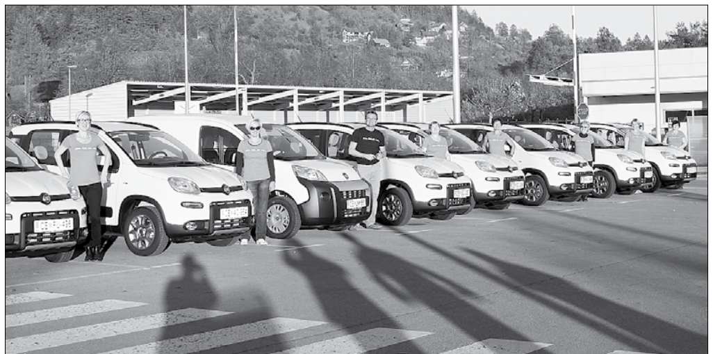
Le malo je med patronažnimi sestrami takšnih, ki se še spomnijo, kako je za službo imeti službeni avto, mlajše to vedo od prejšnjega tedna.

vozele nova vozila, primerna tudi za težavne terene, med sestrami v patronažni službi ni manjkalo. Svoje veselje so sestre in hišnik izrazili tudi z notnimi majicami, ki so si