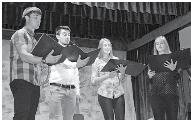
Ubrano petje zasedbe Mladi rod je navdušilo obiskovalce prireditve.