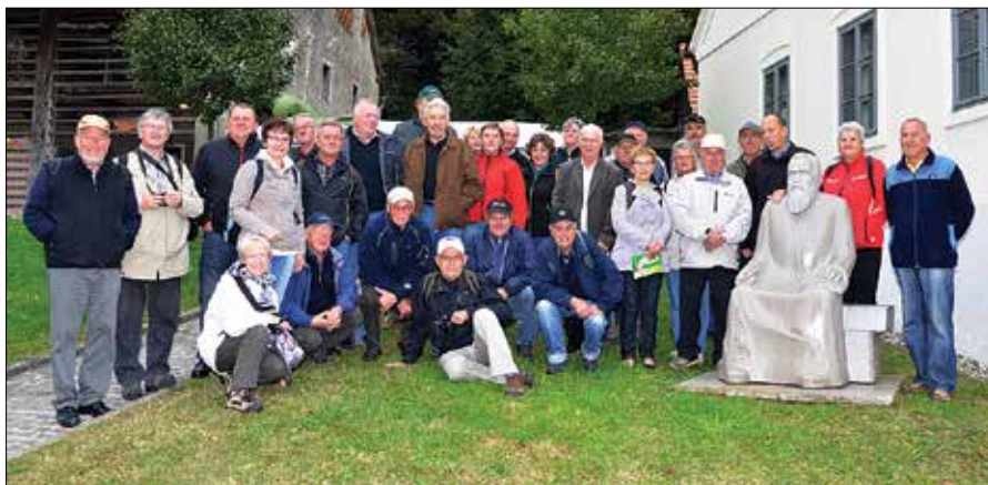
Člani mozirskega sadjarskega društva praznik izkoristijo kot možnost za druženje in obenem strokovno ekskurzijo.