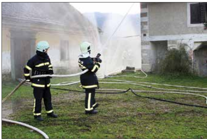
Gasilska intervencija v Spodnjih Krašah je stekla, kot da bi šlo zares.

ših preizkušenj znanja, tehnične opremljenosti in funkcioniranja ob takšnih primerih. Vodstvo in gostje so ob tem opravili ogled postopkov gašenja, varovanja sosednjih zgradb z vodnimi curki iz cistern ter iz reke Drete in reševanja ujetega iz goreče hiše.