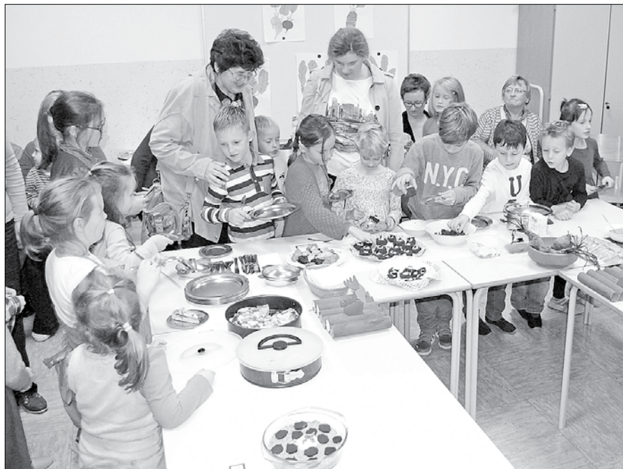
Mamice so pripravile številne jedi, ki so vključevale peso.