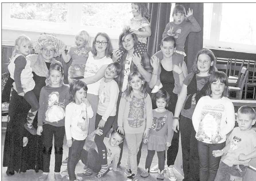
Delavnic v dvorani podružnične osnovne šole v Lepi Njivi se je udeležilo trinajst otrok.