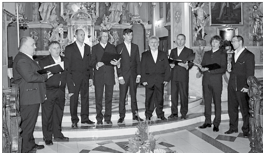
Mozirski koledniki so v cerkvi Sv. Jurija predstavili pester nabor pesmi, še vedno pa prepevajo tudi po domovih kot trikraljevski koledniki.