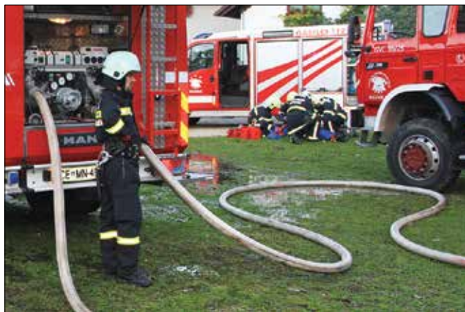
Poškodovancu so gasilci takoj nudili prvo pomoč.

Tako se je na srečo začela le najavljena gasilska vaja, ki so jo na poveljstvih treh društev in v koordinaciji s poveljstvom občine Nazarje načrtovali v mesecu požarne varnosti kot eno pomembnej-