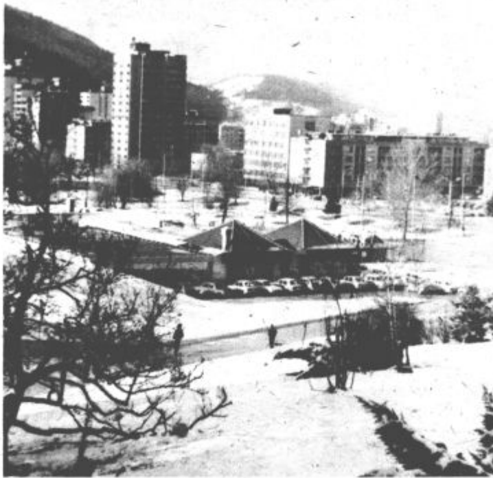
Središče Velenja ob novem letu

Poleg tega pa želimo urediti telefonsko omrežje na zahodnem območju krajevne skupnosti, prav tako tudi toplovodno omrežje, javne razsvetljave na cesti XIV divizije, dokončno urediti otroško igrišče v soseski Šmartno III., poti za pešce proti novi – IV. osnovni šoli ter skrbeli za čistočo okolja.