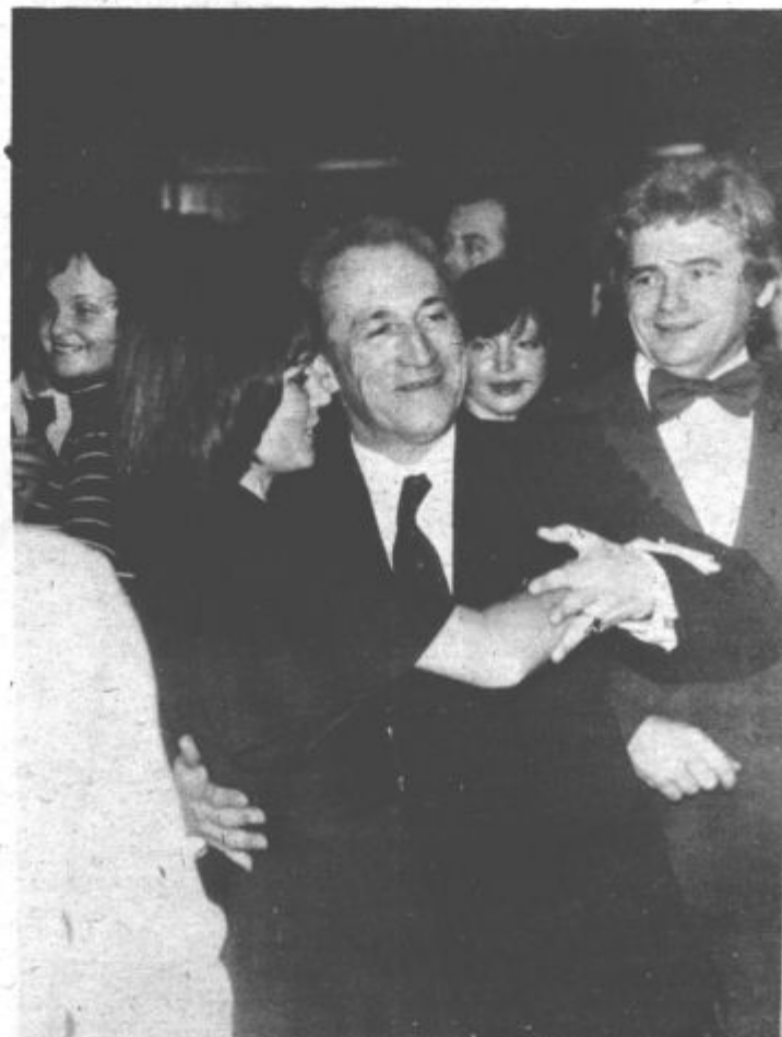
Mnoge je privabil na čakanje novega leta v Rdeči dvorani v Velenju tudi Mija Aleksič. Vendar pa znani Cule ni spravljal ljudi le v smeh, ampak je pokazal, da se zna tudi dobro zavrteni ob slovenskih vzhah.

stvu in višjo stopnjo zaposlovanja kot smo se dogovorili, so pri posameznih interesnih skupnostih večji prihodki sredstev, kot smo jih načrtovali v začetku lanskega leta. Na zadnji seji skupščine je bilo zato predlagano zboru združenega dela občinske skupščine, naj da soglasje za uporabo teh sredstev za pokritje obveznosti in za financiranje dopolnilnih programov posamezne samoupravne interesne skupnosti, za valorizacijo OD in za naložbe v otroško varstvo, šolstvo in zdravstvo. Zbor združenega dela je potrebno soglasje k temu predlogu tudi dal.