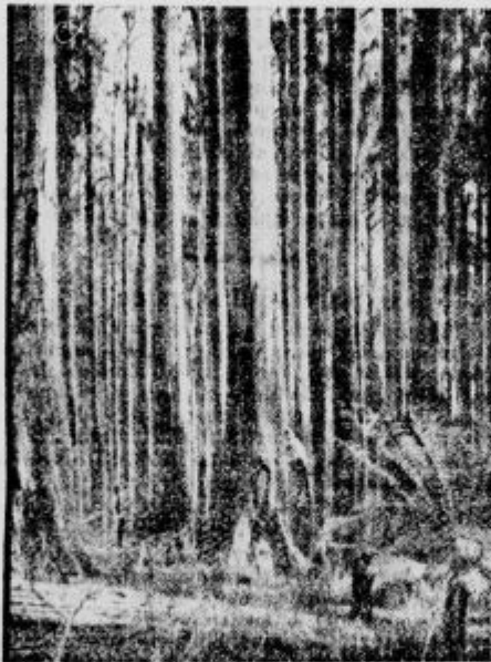
Gozd evkaliptovskih dreves, visokih do 155 metrov — v Avstraliji

V kraljestvu rastlin imamo največ nasprotij. Drobne alge, ki žive v vodah, na mokrih skalah ali na vlažnih delih drugih rastlin, so tako majhne, da jih s prostim očesom niti ne vidimo. Le ogromno število teh majhnih živih bitij da značilno zeleno plast, ki se največkrat dela v stoječi vodi. V nasprotju alg so največkratnejše zgradbe, pravi živi spomeniki rastlin — drevesa. Že naše smreke s 50 m višine in jelke s 65 m visokimi debli so prava čudesa narave. Človeške roke nikdar ne bodo mogle zgraditi tako vitkega in visokega stolpa, kakor jih dela narava. Poleg tega je dreveje elastično in prožno. Lahko se upogiblje in priklanja, kadar se zbudi vihar. Če pogledamo tovarniške dimnike in jih primerjamo z enako visokimi drevesi, bomo doumeli vso mo-