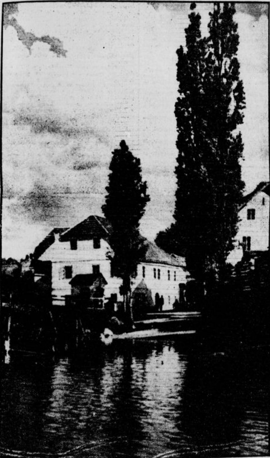
Starodavni Žužemberk ob tih Krki