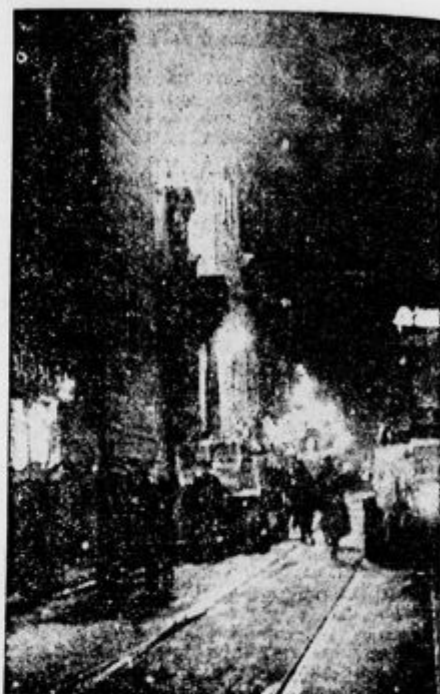
Katoliška cerkev v Barceloni gori; zažgali so jo komunisti