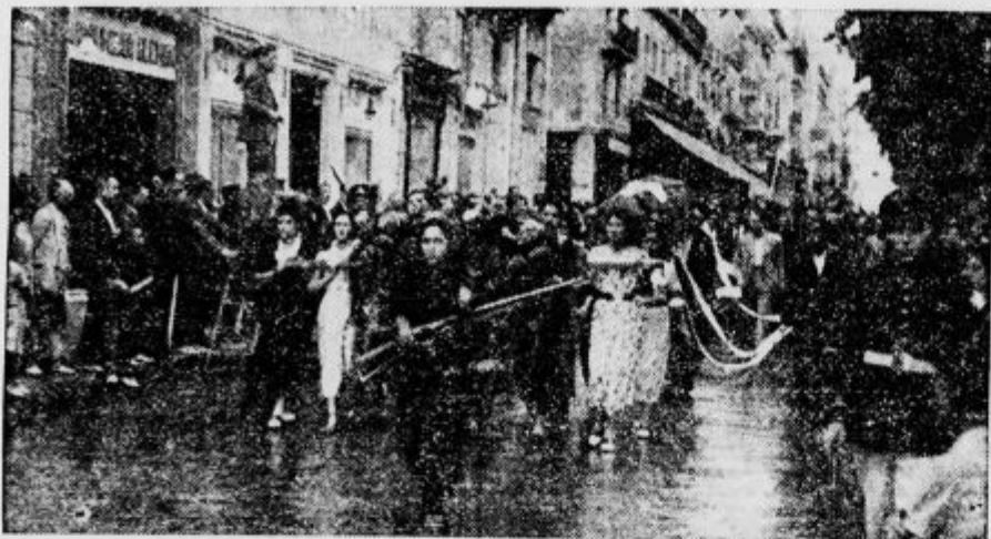
Komunistični pogreb v Barceloni: križ nadomestuje puška