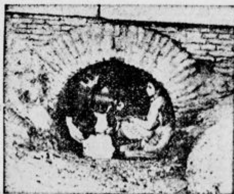
Otroci iščejo zavetišča pod mostovi

Neusmiljeno so španski komunisti »likvidirali«, to se pravi pokradli iz katoliških cerkva vse posvečene dragocenosti in oskrunili celo grobove redovnikov in redovnic. Nazadnje je katoliško ljudstvo zmagalo in je neusmiljeno izvršilo likvidacijo španskega komunizma na način, ki ministrom naše OF gotovo ni neznan in ki se ga opravičeno boje.