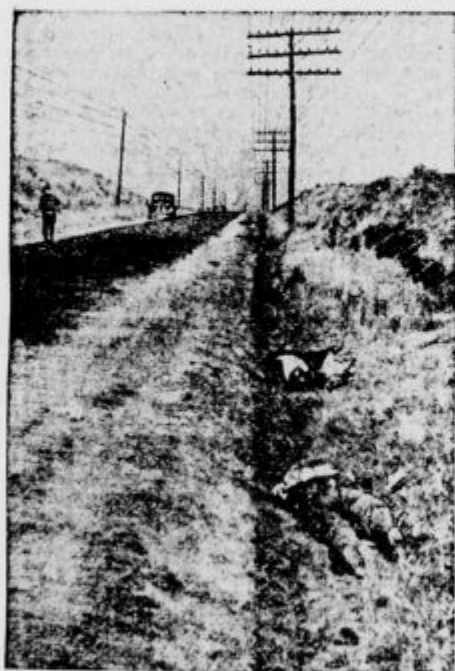
Z mrtiči posejane ceste

V španski državljanski vojni se je komunizem posebno razdivjal v velikem primorskem mestu Barceloni. Žrtve krvavega brezverstva so bili ne samo katoliški duhovniki, redovniki in redovnice ter njihovi domovi, temveč tudi mnogi katoliško misleči in živeči Španci.