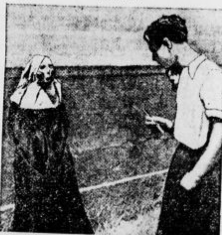
Oskrunjeno truplo redovnice v Barceloni