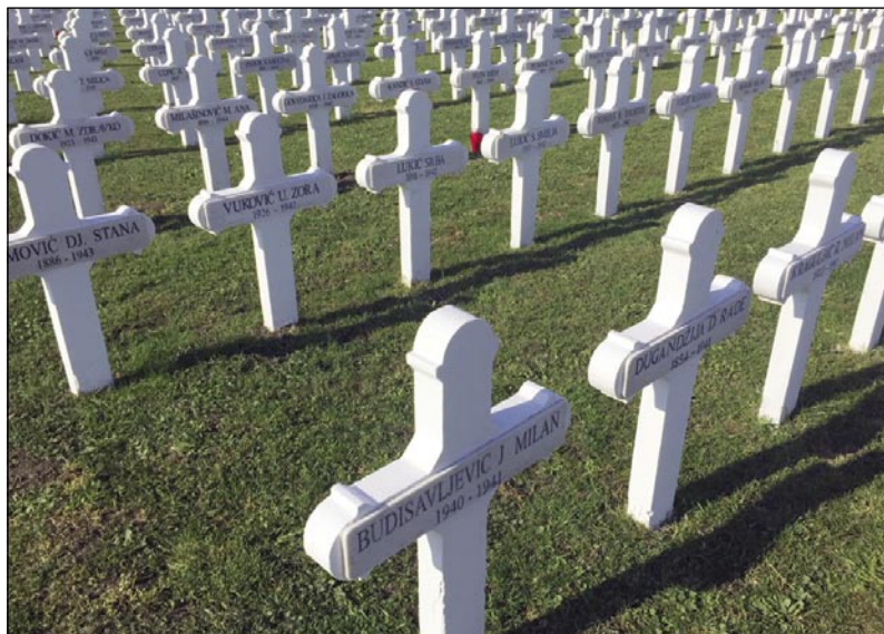
Med mnogimi srbskimi imeni na križih najdemo tudi nekaj slovenskih

minjanja predamo prihajajočim rodovom. Predstavniki Zveze združenj