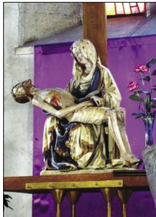
Sočutna iz v kapeli Žalostne M. Božje v Celju

Kip Solčavske Marije so v 15. stol. prenesli iz benediktinskega samostana v Gornjem Gradu v Solčavo. Z vseh strani izklesana Marija z otrokom sedi na nizki profilirani klopi. Jezus, ki je obrnjen frontalno, dviga desnico v blagoslov, v levici pa drži kroglo. Marija ima do tal segajočo modro obleko in čez rdeč plašč, glavo ji pokriva tančica. V primerjavi s Krakovsko Ma-