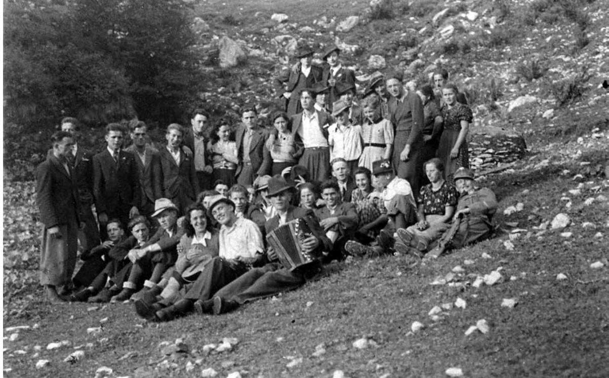
Mladina pri Malnarjevi koči