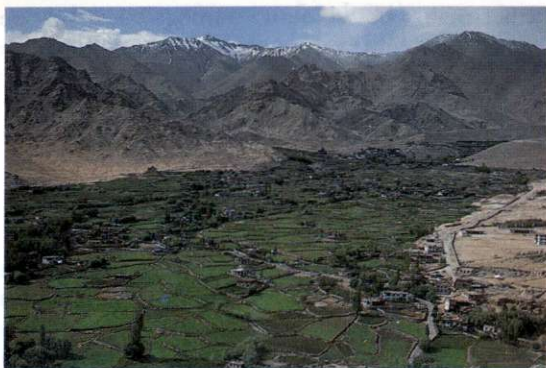
Slika 1: Že vzpon na bližnje vzpetine pričara čudovito kontrastnost pokrajine: trdo rumenilo kamnite puščave in vpijoče, sveže zelenilo bogatih polj, pregrajenih s kamnitimi zidovi, med katerimi so samotne hiše in redko drevje topolov in vrb, ki služi za gradnjo in kurjavo. Posnetek prikazuje velik obdelovalni kompleks severno od pokrajinskega središča Leh v smeri proti kitajski meji. Vodnat pritok Inda dopušča namakanje na veliki površini, kar je omogočilo tudi nastanek in razvoj večjega naselja.