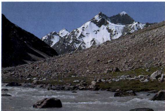
Slika 3: Najbolj izrazita reliefna enota v Ladaku je Visoka Himalaja, ki pa v tem delu ne presega višine 7100 m. Za razliko od dolomitnega Zanskarskega gorovja jo sestavljajo magmatske in metamorfne kamnine, ki jih preoblikujejo številni ledeniki, na namočenih južnih pobočjih dolgi tudi več kot 30 km, na severnih obronkov pa bistveno krajši.

in je primerljiva z Indijsko puščavo. Le v Zanskarju na jugu Ladaka je pozimi več snega.