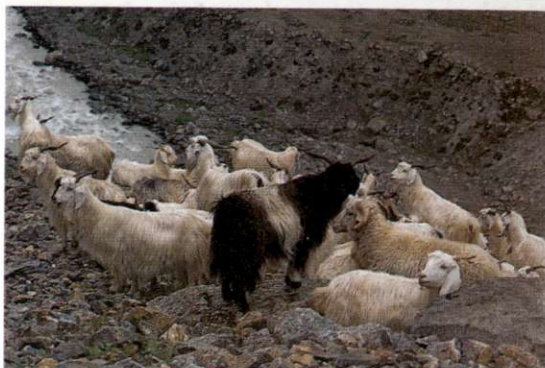
Slika 2: Povsod, zlasti pa v višje ležečih naseljih, kjer prevladuje nomadsko pašno gospodarstvo, ima skoraj vsaka družina živino, če ne drugega vsaj kozo ali dve. Poleti se velike črede jakov preselijo na visokogorske pašnike nad 4000 m visoko. Glavni vir dohodka za živinorejce je kozjereja, katere proizvod je volna pašmina, pravzaprav puh na prsih odraslih živali. Ena žival da letno okrog 500 gramov puha, ki ga rokodelci v Kašmirju predelajo v tople in mehke šale, zelo iskane in cenjene na trgih širom sveta.