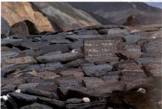
Slika 4: Med najbolj značilnimi budističnimi elementi v Ladaku so zidovi Mani, ki so praviloma blizu vasi, lahko pa stojijo tudi osamljeno. Visoki so meter do dva, široki dva do tri metre, v dolžino pa merijo od nekaj metrov pa vse tja do kilometra. Na vrhu so raznobarvni ploščati kamni z ugraviranimi molitvami (mantrami): Om Mani Padme Hum ali po naše "Pozdravljen dragulj v lotusovem cvetu".

goloto in pomanjkanjem zelenja, vendar je bila pred tisočletji, ko so se naseljevali prvi priseljenci, manj izrazita, saj so tu