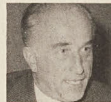
Ciril Stern — avstrijski generalni konzul v Beogradu