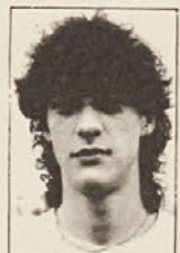
Pleschgatternig ni le dobro igral, temveč tudi zadel edini gol za Globašane.

Kapelčanov je bila kljub temu zaslužena!