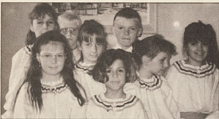
Del otroškega zbora KPD „Drava“ iz Žvabeka