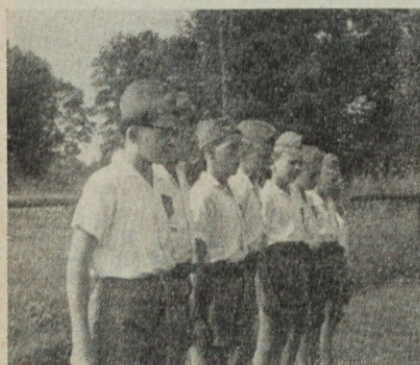
Mladi gasilci pred tekmovanjem v Jaršah

Prijetno razpoloženi gostje delavskega sveta so preostali čas popoldneva ostali v prijetnem pomenku in živo obujali spomine »na dvajset let«. Odveč je le razmišljanje mlajših, kako »daleč« je še do upokojitve čeprav je precej pomenkov ubralo tudi to pot. No, na kraju je bilo vse prijetno in bo ostala pogostitev tudi letošnjim dvajsetletnikom v lepem spominu.