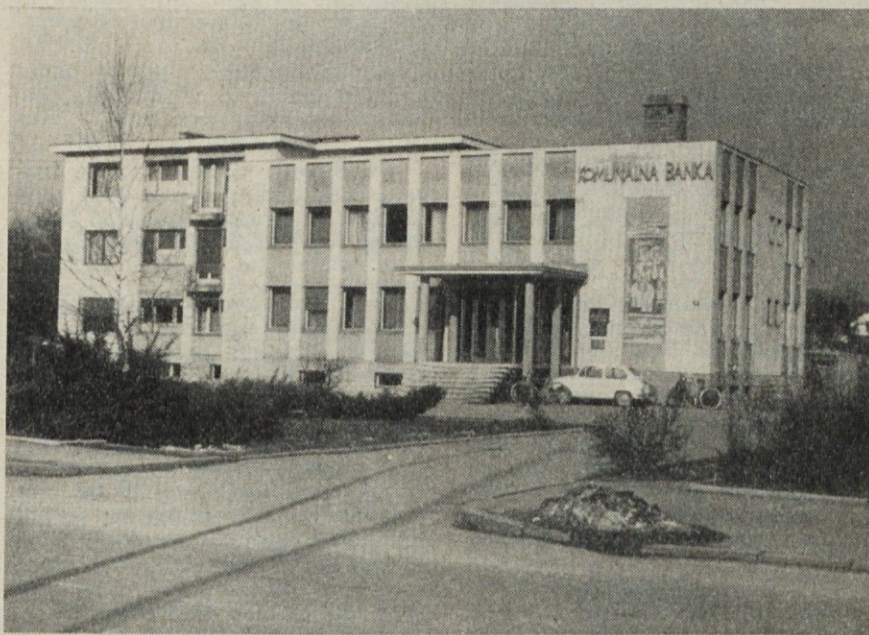
Banka postaja gospodarska organizacija ali vsaj odvisna od gospodarskih organizacij

vsak narod po lastni poti do skupnega cilja, to je do osvoboditve in do socializma. Ravno to je tudi razlog, da je poti v socializem več, to je tudi potrdilo, da je teženj po osvoboditvi danes več, kod kdajkoli prej in, da je Oktobrska revolucija resnično premik človekove miselnosti.