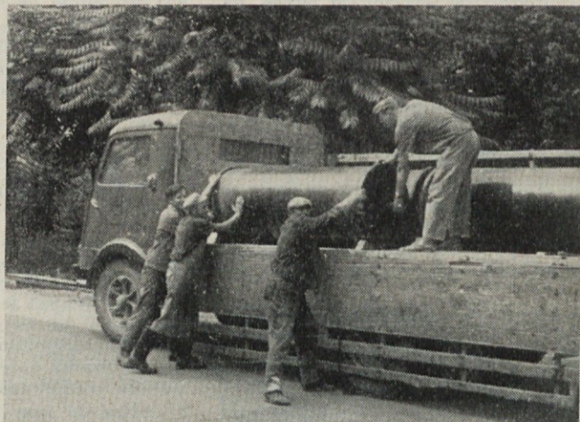
Razkladanje delov stroja za oplemenitenje tkanin.