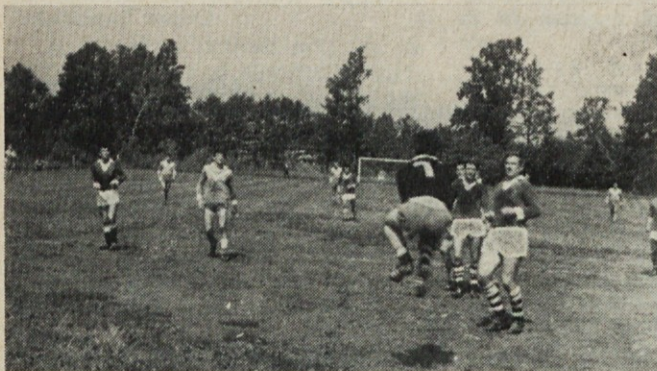
Prizor pred jarškim golom na tekmi Dob : Induplati

Pri tkalskem stroju obstajajo še druge nevarnosti, predvsem ob izletu čolnička, pri snemanju valjev, pri utežeh ipd. Zato naj ta sestavek velja kot ponovno opozorilo na nevarnosti pri tkalskih strojih. Ob upoštevanju teh nevarnosti bo še manj nezgod v tkalnici, kar bo vplivalo na manj zastojev in na neprilike za posameznika ob nezgodi in po njej. Bodimo pri svojem delu previdni, zbrani in dosledni. Tako bo naše delo še varneje.