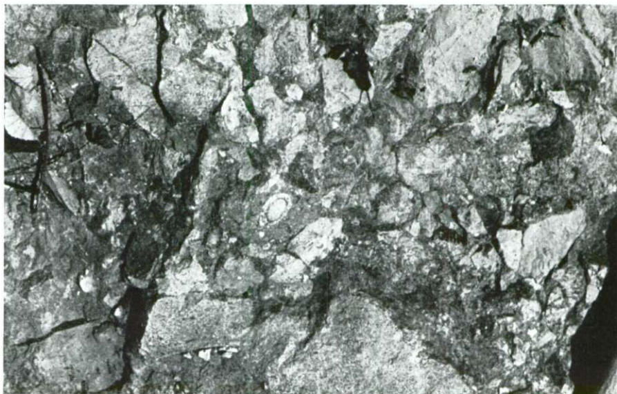
2. sl. Apnena breča s preseki radiolitov Fig. 2. Limestone breccia with Radiolites sections