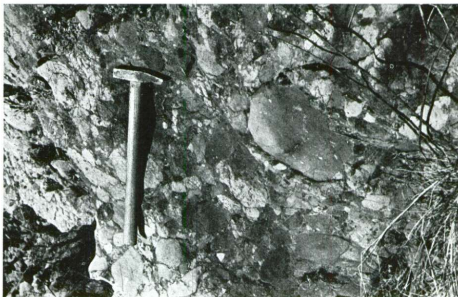
1. sl. Apnena breča Fig. 1. Limestone breccia