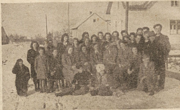
Udeleženci tečaja za pionirske vaditelje v Brežicah

Mladinska organizacija v Krškem okraju se je pred kongresom SKOJ-a in LMS precej razživela. Ne samo, da se je organizacijsko utrdila, temveč se je tudi razširila. Marsikje so se ustanovili novi aktivisti, ki danes že napovedujejo tekmovanje drugim, starim aktivom. Da bi vse te uspehe in pomanjkljivosti pregledali, da bi se temeljito pripravili na volitve v nove sekretariate, je okrajni komitet LMS sklical v nedeljo 23. januarja okrajno konferenco sekretarjev in organizacijskih sekretarjev mladine.