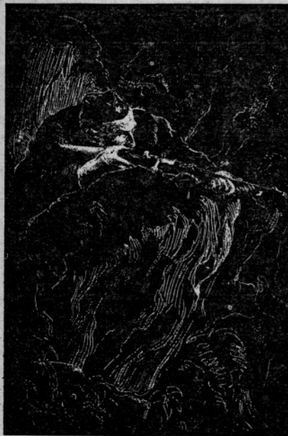
BOZIDAR JAKAC: Partizan v zasedi

3. Usposobiti prosvetne delavce in preko njih šolske otroke za učinkovito samozaščito pred vojaškimi napadi. Organizirati in usposobiti ekipe prve pomoči na šolah, kakor tudi usposobiti otroke za propagandno obveščevalno dejavnost.