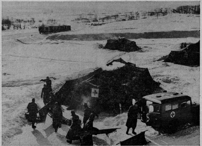
CENTER ZA SPREJEM RANJENCEV