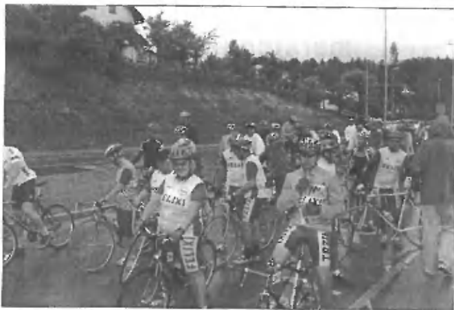
Deževen dan, teška vožnja zato pa ob prejetih pokalih toliko lepši konec maratona

Lenarjenje nikomur ne koristi, tega se Felixi dobro zavedamo. Že naslednjo nedeljo smo se zbrali pred Mercatorjem v Trzinu, prisluhnili nasvetom in navodilom našega mentorja Srečka Frantarja ter drug za drugim krenili na pot proti Kamniški Bistrici. Kolona 35 kolesarjev, starih od 10 pa tja do 69 let, je v sončnem razpoloženju že na daleč opozarjala na ime kraja, od koder prihajamo. Prepoznavnost trzinskih Felixov je z vsako vožnjo večja in očitnejša. Tako je tudi prav, saj vzdrževanje koles ni zastoj in sredstva, ki jih zbere kolesarska sekcija pri