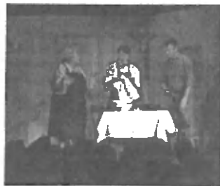
Utrinek iz enodejanke Mati .