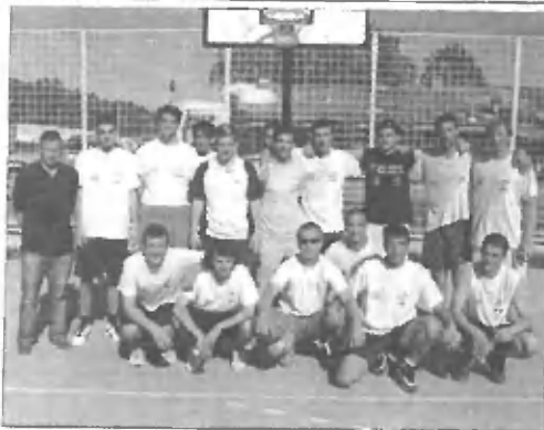
Trzinski igralci, ki so vztrajali do konca!