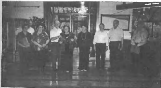
Šmarješke Toplice: Čeprav na prepihu so se besede o ljubezni dobro usedale v duša.

Pri tem so nam s prevozom s kombijem pomagali naslednji sponzorji: Prostovoljno gasilsko društvo Trzin. Društvo za raziskovanje jam Simon Robič Domžale in Osnovna šola Trzin. Vsem iskrena hvala!