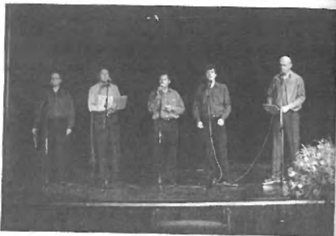
Pevski kvintet Vocalissimo