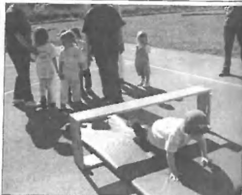
Saj veste - važno je sodelovati!