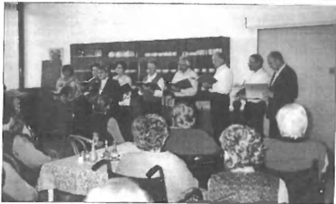
Dom starejših občanov na Planini pri Kranju: Spomin na prvo ljubezen nikoli ne umre

hvaležnosti, ki so nam jo izkazali, smo se zadovoljni vrnili domov. Občutek, da smo nekaterim popestrili dan, zlasti tistim, ki zaradi različnih vzrokov in starosti težje prenašajo vsakdanjo monotonost, nas je napolnil z radostjo, in smo se brez težav še isti dan zvečer podali na drugo predstavitev - v KUD Groblje. V mali dvorani je bilo vzdušje prijetno, med gledalci in izvajalci se je prepletala koprnata povezanost, ki se je z vsako pesmi malo vedno bolj udomačevala. Čeprav smo z našim recitalom oziroma njegovo zvrstjo od ske uprizoritve orali ledino v tem KUD-u, še zdaleč ne moremo reči, da se prhodnje ne bo kaj podobnega spet dogajalo na tem prizorišču. Zamatne vrtnice