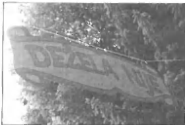
Dobrodošli v deželi Nije

Vendar pa v deželi Nije ni vse tako rožnato, kajti v zalivu nedaleč stran je zadržana ladja zlobnega kapitana Kljuko, ki ima s Petrom še nekaj