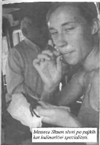
Mesece Škion stavi po pajkih kot kulturni specialiteto.

blizno dva kilometra dolgem obrečnem pasu že navsezgodaj zjutraj ob stojnicah, kjer so pradjali hrano, pijačo in srečke, gnetla množica razposajenih ljudi, ki so nestrpno pogledovali proti ekipam čolnarjev, ki so se pripravljali na tekmovalne. Ekip je bilo nekaj čez dvajset, bile pa so kar številčne, saj so bili ozki čolni res neznansko dolgi, pa tudi lepo okrašeni. Najprej so se tekmovalci nekaj časa samo ogrevali in se vozili sem ter tja po vodi. kmalu pa so odveslali do starta in začeli tekmo. Z vesli so zamahovali v taktu in pri tem spuščali glasne glasove, ki so jim služili za čim večji zagon. Gledalci pa so se ali prerivali med seboj in skušali čimbolj spremljati napeto bitko ali navdušeno popevali pod odrom tik ob prizorišču dogajanja, kjer so se nenehno menjavali pevci in pevke kamboške pop glasbe, ki jih je spremljal ansambel.