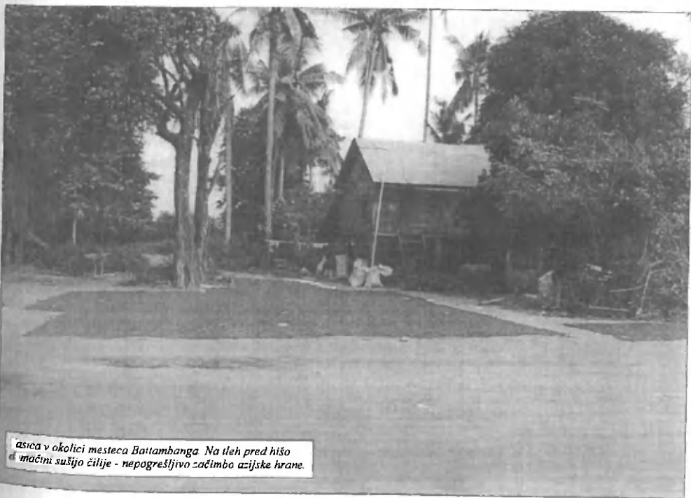
asica v okolici mesteca Battambanga. Na tleh pred hišo mačini sušijo čilije - nepogrešljivo začimbo azijske hrane.

nakoli. Pri tem se sklicujejo na raznovrstne luknje na cesti, katere zares dobro poznajo samo domačini. Ali kot jih je opisal eden izmed najinih voznikov motorja: »Na cestah obstajajo majhne luknje, velike luknje in »fucking« velike luknje.« In tukaj, v Battambangu, nama ni uspelo najeti koles. Kriva pa sem bila jaz, ki se nisem mogla ukloniti presunljivemu in proseče plazečemu pogledu mladega fanta Banye, ki se je na vse pretege trudil, da bi zaslužil kakšen dolar. Za tečaj angleščine, je povedal. Sledil je navdse lep dan, saj smo se ves čas vozili mimo svetlo zelenih riževih polj, palm, mlakuž, kjer so domačini ribarili in so se namakali ogromni vodni bivoli in leno pogledovali po okolici in mimo lesenih hišk na kolih. Banya pa nama je pokazal tudi nekaj tradicionalnih vaških obrtnih delavnic. Tako sva videli, kako domačini iz riževih kosmičev in vode izdelujejo tanke riževe »palačinke«, ki jih najprej spečejo in nato do konca posušijo na soncu. Prodajajo jih restavracijam, kjer jih uporabljajo za pripravo spomladanskih zavitkov in podobno. V neki drugi delavnici so bambusove pa-