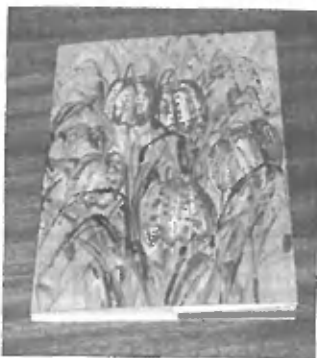
Zbornik podoba na ogled postavi

Po končani prireditvi, ki bi bila lahko za zgled vsem takšnim in drugačnim prireditvam v Trzinu, je sledila zakuska v prostorih avle Centra Ivana Hribarja, kjer so imeli obiskovalci večera priložnost videti tudi rezbarska in slikarska dela žerjavčkov.