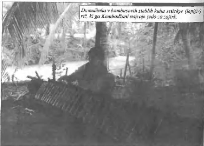
Domačinka v bambusovih steblih kuha sticky (slapjaj) riž, ki ga Kambodžani naproje jedo na zajtrk.

lepo sklada z modrino neba nad otočkom. Okoli hiš, ki stojijo ob poti, ki se vije čez otok, je bilo polno nasadov bananinih palm, pomelovcev in riževih polj, na katerih so kmetje z volovskimi vpregami obdelovali zemljo ali pa sadili riž. Nekaj pomelov sva celo narabotali in pojedli, po »grozodejstvu« pa sva se odplazili na neobljuden prostor tik ob