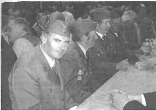
Nekateri borci so srečanje vzeli zares in se temu primerno tudi oblekli.