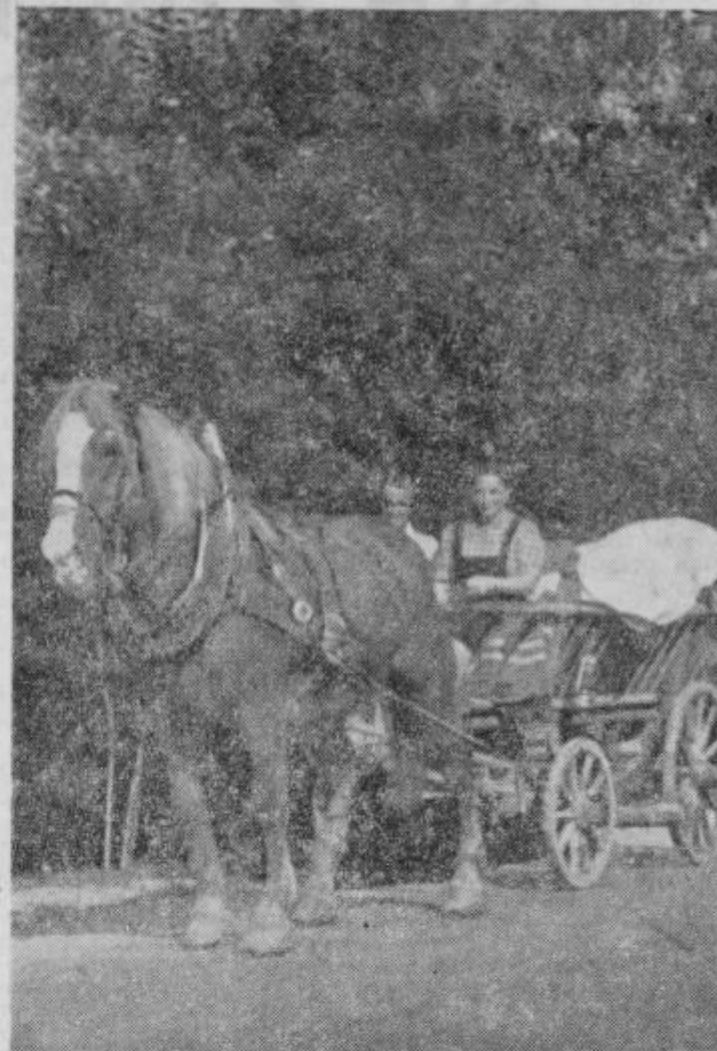
Z zrelo in slovečo ptujsko čebulo po svetu...