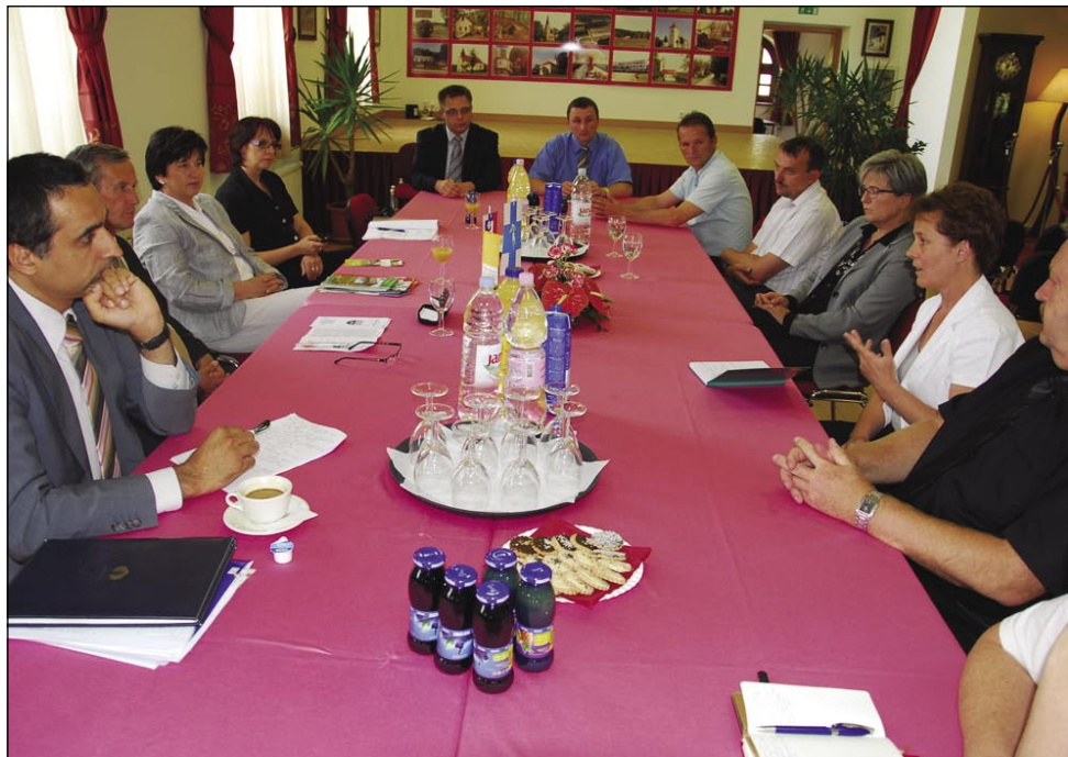
Pogovora v Stanjevcih so se udeležili župani goričkih občin, predstavniki razvojnih agencij, šol in drugih ustanov, ki so tudi do sedaj sodelovali s Porabjem