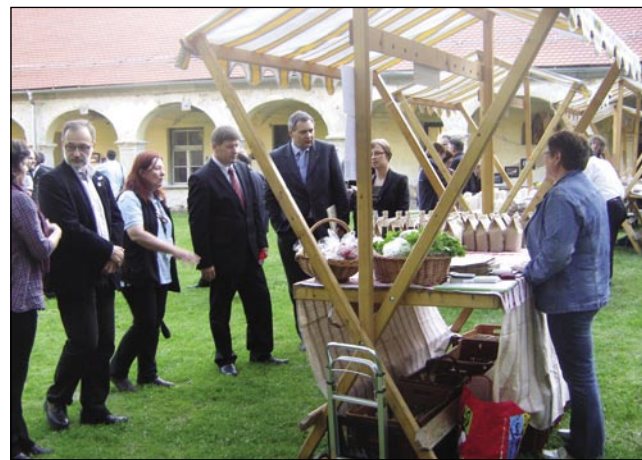
Stojnice na ekološki tržnici je obiskal tudi minister Bogovič

ljeni, moji junaki niso dobili pravice do otroštva. V 5.-6. letu starosti so jih odvedli v vojsko, nekatere so pri 7.-8. letih prisilili k prostituciji. Še mlajši otroci pa morajo opravljati težko in