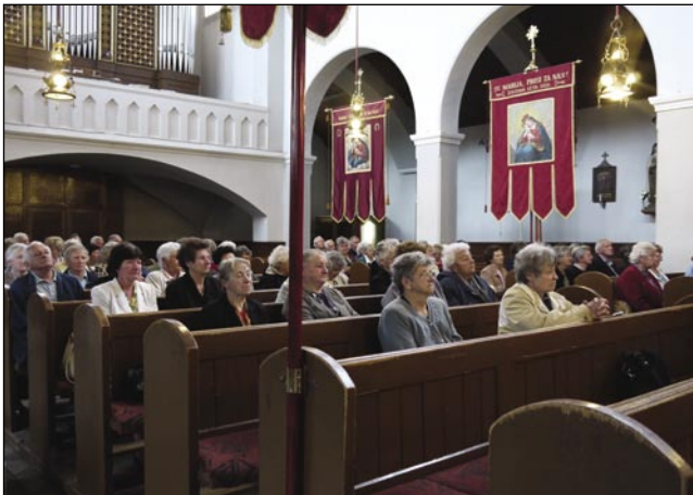
V cerkvi v Turnišči so meli penzionisti mešo

Eštje pred svetov mešov smo se pelali v Dobrovnik v Tropski vrt, gde smo vidli čudovite sorte orhidej in do sta drugoga cvetja. Tü smo