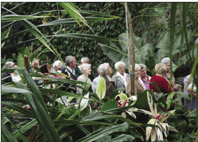
Ogledali so si Tropski vrt v Dobrovniku tö