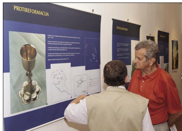
Tisti, steri so prišli na razstavo, so z zanimanjem prebirali besedila. Če so nej znali slovenski, so najšli vogrski prevod tö

za vüzem, gnauk pa geseni, gda so se Baugi zavalili za dober pauv. Ta paut je trpela en keden ali dva, ojdli so pejški. Ništerne ženske so rodile, starejšo lüstvo je meralo. Dostokrat so jim gesti vkradnili po pauti. «Vörnicke so prosili casarico Marijo Terezijo, aj jim donk edno cerkev dopüsti zozidati. Una je tau nej stejla, eške nauvo püšpekijo je staurila v Somboteli. »Njeni sin Jožef II. je biu bole toleranten, v svojoj monarhiji je dopüsto vsikšo vöro: protestantsko, pravoslavno, židauvsko. Tak so v