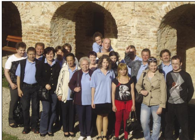
Mešani pevski zbor A. Pavel na grajskom dvorišči

Letošnji gostitelj revije Pesem ne pozna meja je biu Moški pevski zbor Društva vinogradnikov Goričko, steri je revijo organiziro 26. majuša pri Gradi na Goričkom. Na reviji je spejvalo devet slovenski zborov iz Slovenije, Avstrije, Italije in Vogrskoga. (Šest moški zborov, en ženski zbor pa dva mešaniva zbor.)