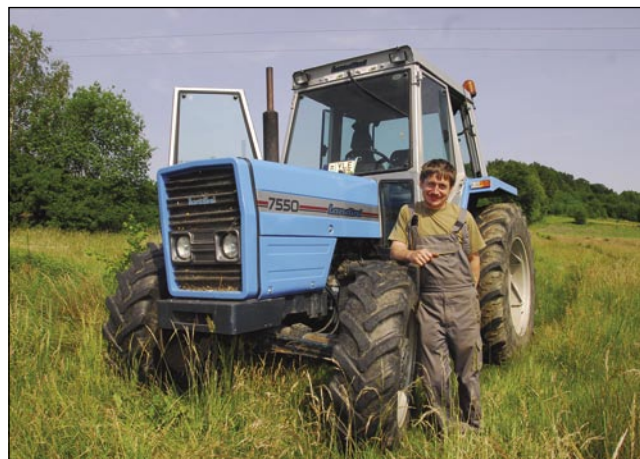
Traktor Razvojne agencije Slovenska krajina, stera de v projekti Upkač čistila pa kosila travnike

- Ti si kama ūšo delat, gda si šaulo zgotauvo?