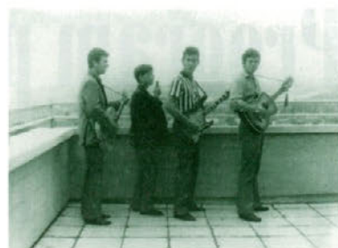
Začeli smo trije z navadnimi akustičnimi kitarami, na katere se je igralo solo, ritem in bas.