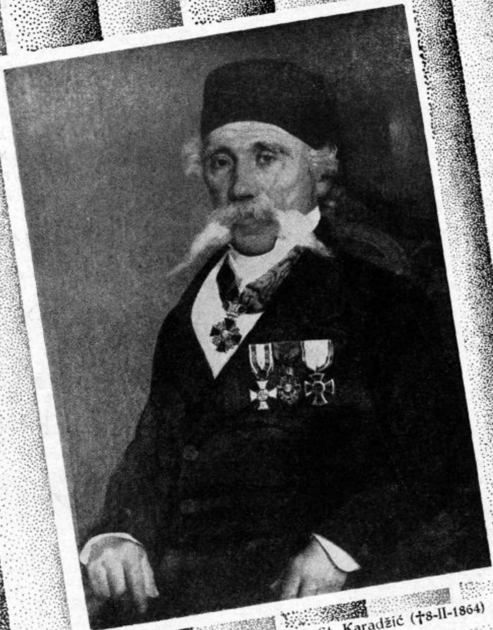
Vuk St. Karadžić (†8-II-1864)