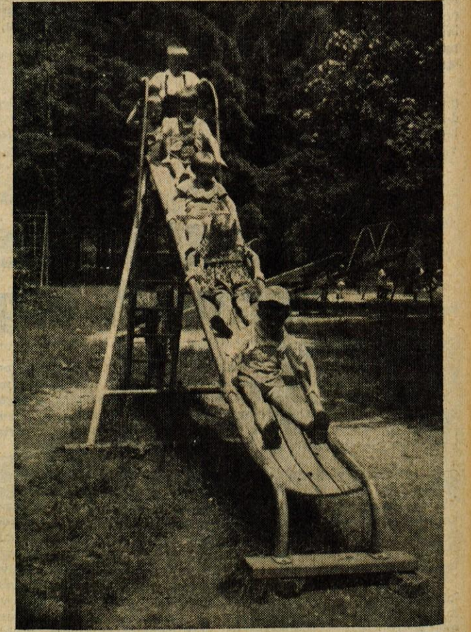
Igra je otrokom najlepše razvedrilo

lične figurice cicibanov in pionirjev v svečanih krojih, v kateri so bili tedaj oblečeni. Tudi vrtljak, klopice in razne fizikulture naprave, ki jih imajo na vrtu, so ponazorili. Razstava otroških izdelkov, ki je odprta od 16. do vključno 18. t. m., je vredna ogleda. Človek mora uživati v bogati fantaziji otroške duševnosti.