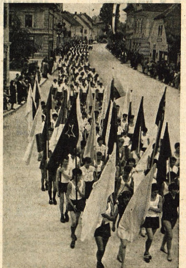
MANIFESTACIJA TELESNE VZGOJE Z večerajšnje parade članov TVD »Partizan« v Kranju

Izdaja: Gorenjski tisk / Ureja: Uredniški odbor / Odgovorni urednik: Slavko Beznik Telef. uredništva 475 — uprave 190 / Tekoči račun pri Komunalni banki Kranj šte. 61-KB-1-Z-135 / Izhaja v ponedeljek in petek / Naročnina: letna 600, polletna 300, mesečna 50 dinarjev.