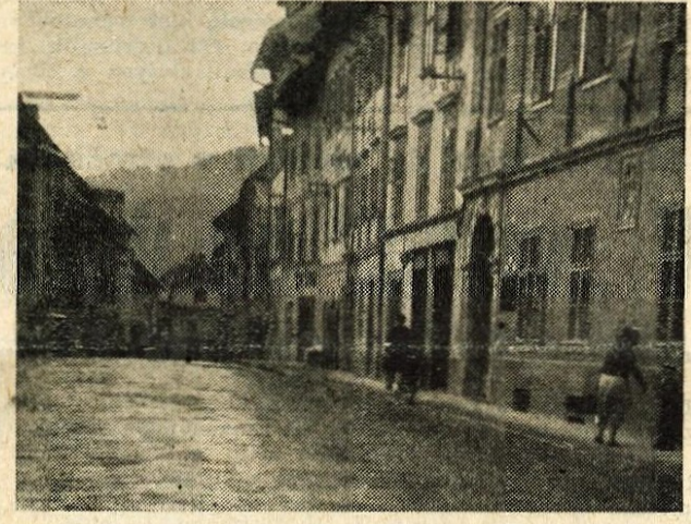
Mestni trg v Loki je vsak ponedeljek prazen

za 86%. Mlinsko podjetje Trata bo namreč zmlelo večje količine moke kot v prejšnjem letu, in sicer 4000 ton bele moke namram 2263 ton v lanskem letu in 500 ton koruzne moke namram 39 ton v lanskem letu.