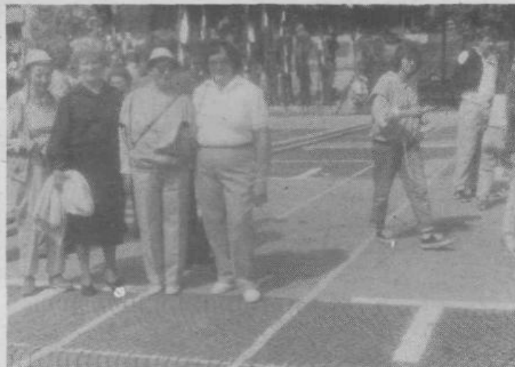
Udeleženke pohoda Po poteh spominov in tovarištva v Ljubljani