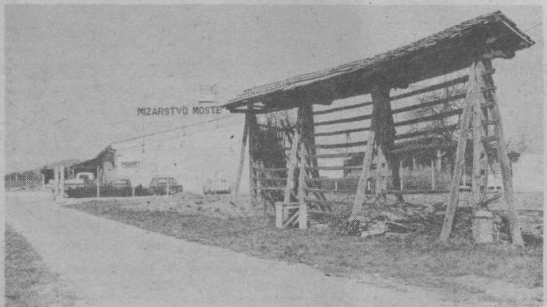
Novo proizvodne hale omogočajo Mizarstvu Moste uvajanje v proizvodnjo sodobne tehnologije