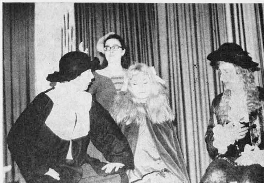
Člani dramske skupine »Standrež« v komediji »Zdravnik po sili«

Goriško društvo je tako s svojim plodnim delovanjem dokazalo, da še vedno nadaljuje z nekdanjo tradicijo, ko je bilo pravo gibalno vsega kulturnega delovanja v Gorici.