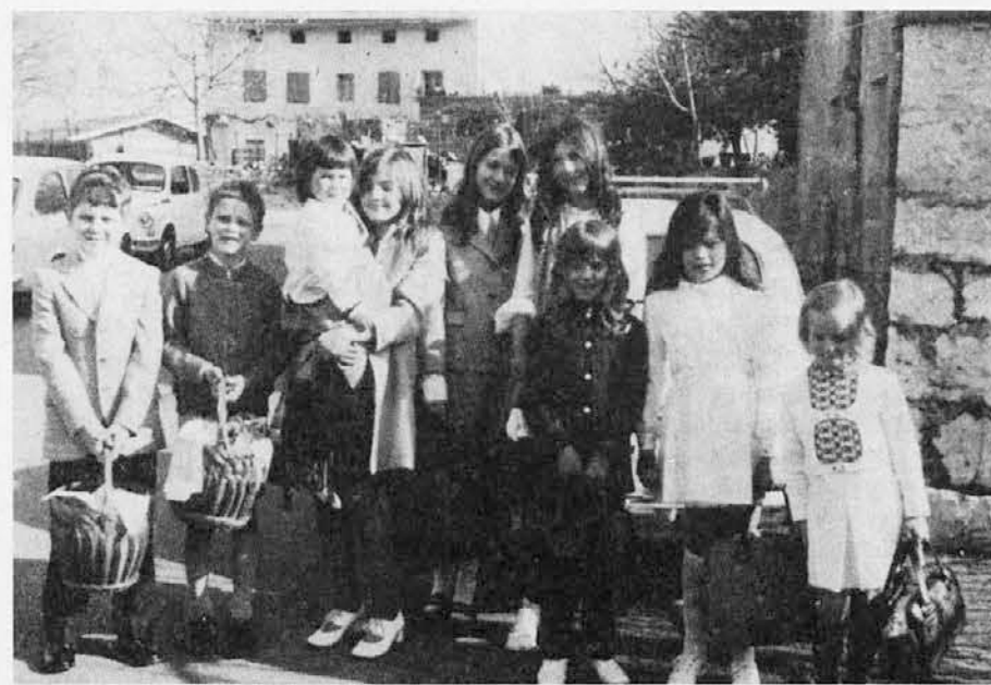
Velikonočni zegen v Poljanah v doberdobski fari