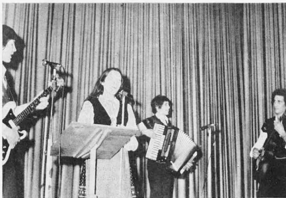
»Veseli Steverjanci« pojejo na proslavi 20-letnice njihovega društva

Pri nas so gostovala naslednja društva: trikrat PD iz Standreža in enkrat PD iz Podgore. Ob petletnici otvoritve doma smo povabili Fante izpod Grmade, v no-