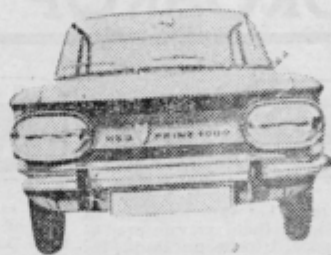
NSU 1000 C

V začetku julija bo izžrebanih med vlagatelje