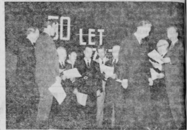
Na proslavi ob 50. obletnici ZKJ je zapel poljčanski pe- ski zbor