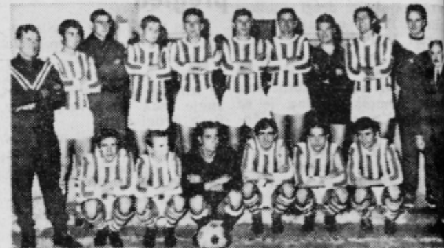
Igralci Drave so dosegli največji uspeh, vstop v slovensko ligo

I. Krnič, najboljši strelca: »Golov v jesenskem in spomladanskem delu prvenstva: »Prisenetilo me je veliko prijatel-