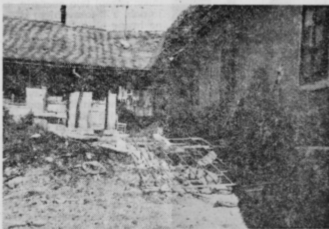
Kako prenašajo stanovalci tako neurejeno dvorišče?

S samoprispevkom, kreditom in udeležbo občanov in delovnih organizacij so zagotovili sredstva za asfaltiranje. Ker ne morejo pričeti z delom brez odobrenja republiškega sklada, čakajo na njegov »žegen«, kot pravijo tamkajšnji prebivalci. Obsojajo dejstvo, da sklad samo »drži roko« nad omenjeno cesto, modernizira pa je ne, niti nič ne prispeva. Prebivalci upajo, da republiški organi ne bodo stvari predolgo zadrževali in da bodo odobrili modernizacijo (asfaltiranje) na običajni način. Če bodo zahtevali močnejšo in seveda dražjo varianto, ne bo dovolj sredstev. Če republiški organ smatra, da je cesta takega pomena, da je treba močna gradnja, je prav žalostno, da sam ne poskrbi za njeno modernizacijo. Občestni prebivalci bi se radi vsaj rešili prahu, drugi pa nestetih jam na makadamu. Pristojni so že sklenili, da bodo kljub »boljši« zahtevi asfaltirali na običajni način, katerega bodo zmogli z zbranimi sredstvi. Menijo, da se samo na »žegen« ne bodo ozirali. Prav radi pa bodo pomagali, če bi pri večji in močnejši modernizaciji omenjene ceste sodeloval tudi republiški cestni sklad. ZR