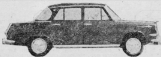
SKODA 1000 MB

VLGATELJI VEZANIH VLOG IN LASTNIKI VEZANIH DEVIZNIH ZIRO RAČUNOV — NAGRADE VAS ČAKAJO!