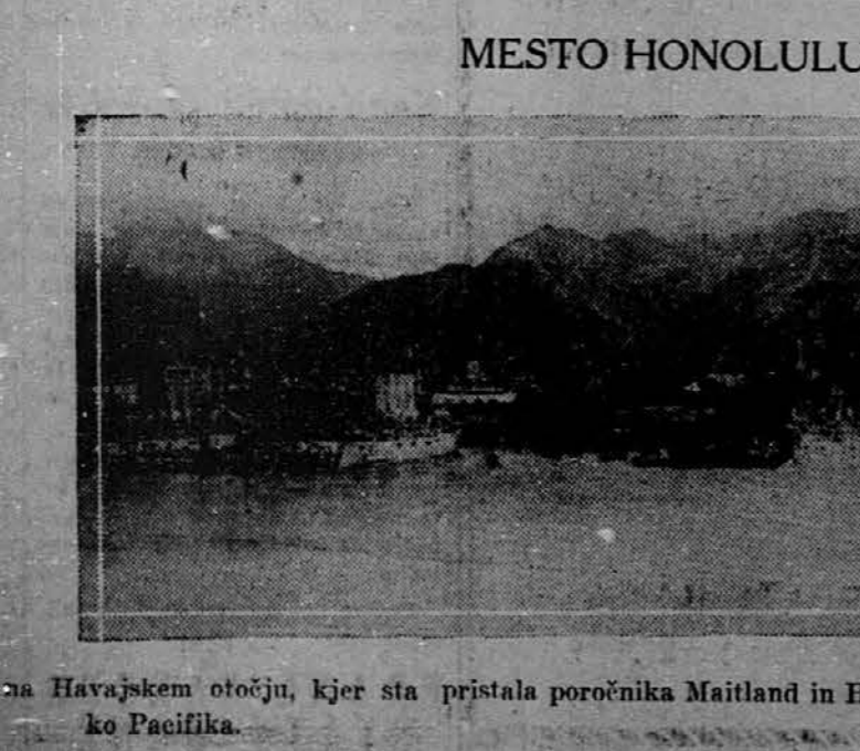
na Havajskem otočju, kjer sta pristala poročnika Maitland in Hegenberger po svojem poletu preko Pacifika.