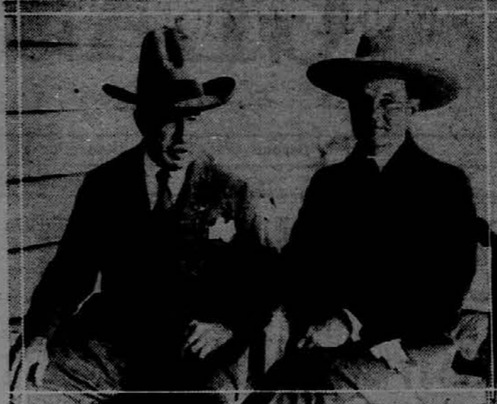
Ko se je vrnil governor Filipinskega otočja, generalni major Wood, v Združene države, je najprej obiskal predsednika Coolidge-a v njegovem poletnem bivališču v Black Hills, So. Dakota.