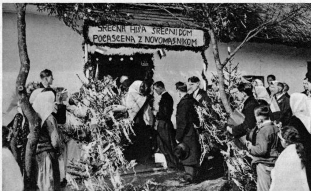
Pred novo sv. mašo na domu

Vedela sem, da bi njeno naglo in toplo čuteče srce moglo povzročiti kako nevarnost, zato sem bila oprezna. Nekaj mesecev sem