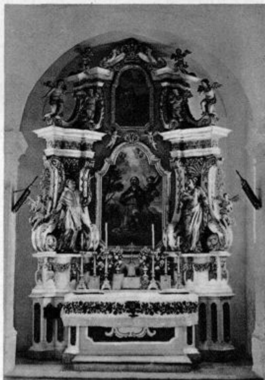
Oltar sv. Roka v Trzinu

»Milost božja do mene ni bila prazna« (I Kor. 15, 10) — pravi sveti Pavel. In v dnevnicah sv. Stanislava polaga sveta Cerkev