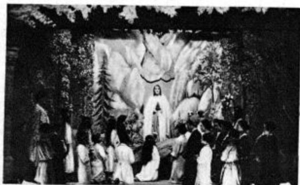
Zadnji prizor iz „Lurške pastirice“ - Vodice

Njena pokorščina se je tako spopolnjevala, da ji nič več ni šlo v glavo, kako je mogoče, da bi kdo božjo zapoved prelomil. Najrahljši migljaj je bil zanjo prav tako svet, kakor vsak resen ukaz. Pozimi je mnogo trpela, ker je imela ozeblina na rokah; pa ni nikdar tožila in se tudi ni drgnila, ker je bilo v razredu prepovedano. Napravile so se ji celo rane, ki so se s snemanjem rokavic včasih še povečale.