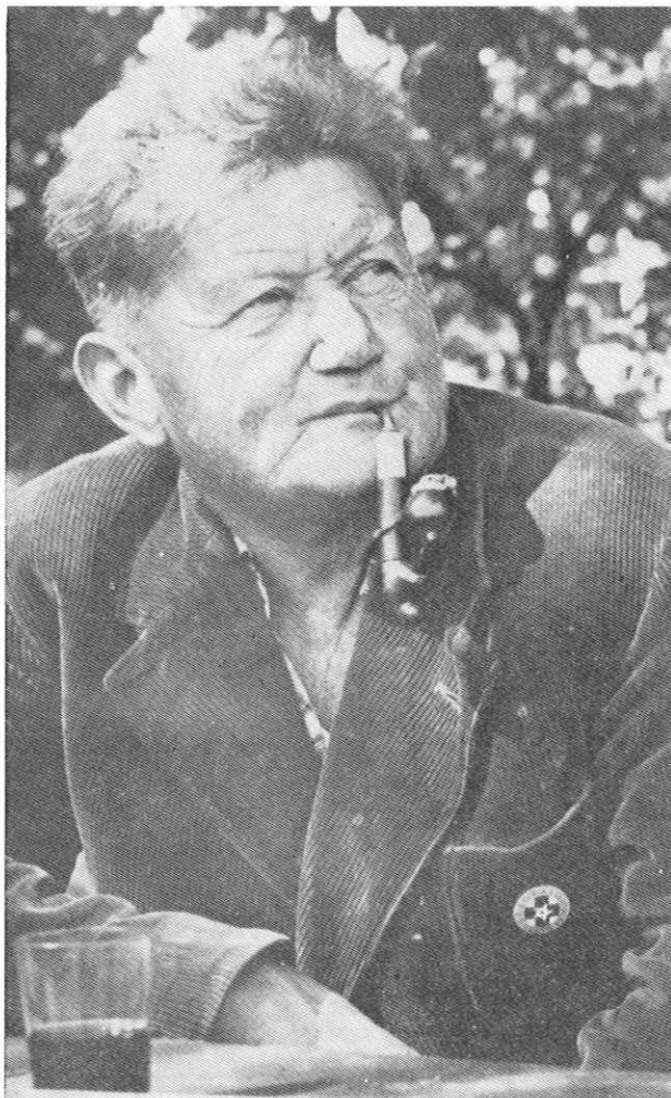
Joža Čop, najpopularnejši slovenski planinec

(Pred 5 leti, 30. 6. 1975, je umrl Joža Čop)