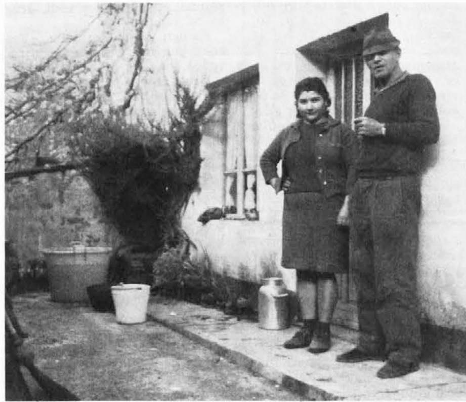
Zakonca Juhova iz Salandrov nad Ahtnom sta se rada postavila pred fotokamero našega reporterja

Nato nam je začel pripovedovati o svoji življenjski poti, povedal nam je, da je pred dvajsetimi leti delal celo v Ljubljani, potem pa se je zaposlil kot delovodja pri gradnji gozdnih in drugih poti na svojem območju. Vendar ga je med delom pred sedmimi leti doletela huda nesreča: ko je snemal lesene opaze z nekega, pravkar zgrajenega mostu, mu je po nesreči priletel v oko oster košček deske in mu odvzel vid. Da ne prihaja nesreča