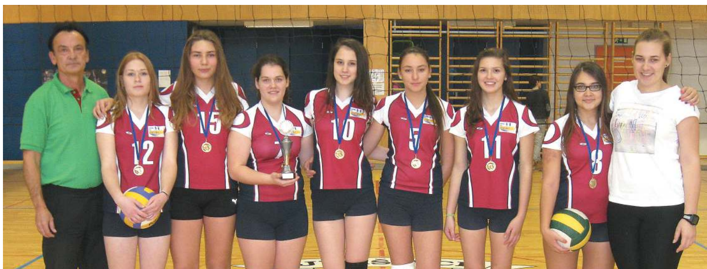
Odbojkarice OŠ Juršinci postale medobčinske prvakinja.