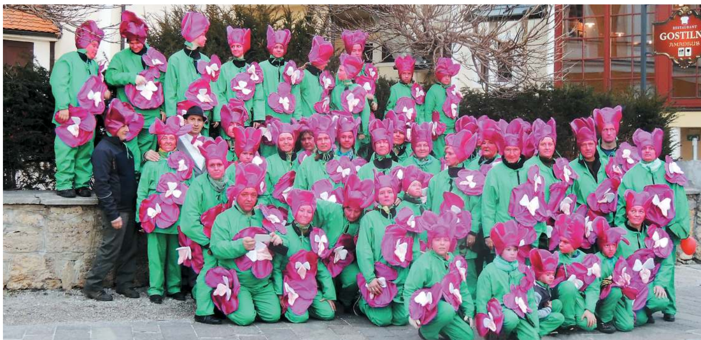
Člani KED Juršinci so za novo pustno obleko izbrali kostum orhideje.