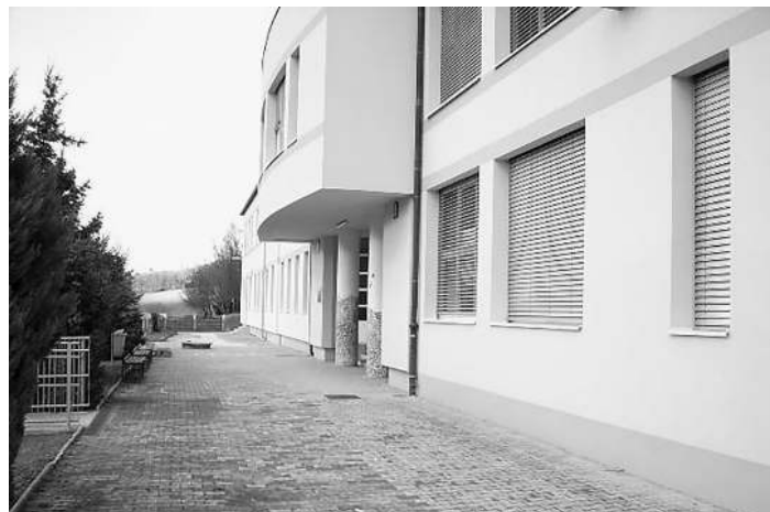
Šolsko poslopje danes.