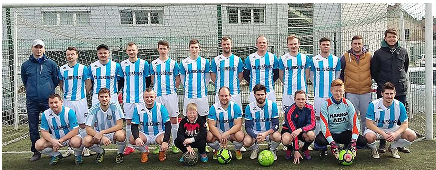
Nogometna reprezentanca ŠD Juršinci.