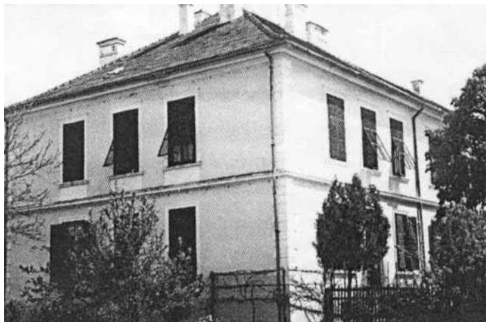
Šolsko poslopje, zgrajeno leta 1895, prizidano leta 1909.