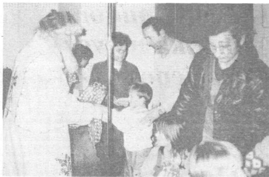
Med dedki Mrazi, ki smo jih srečevali lani, je bil sivolasi očak iz Lutkovnega gledališča, najbolj voljan poslušati otroke in jim odgovarjati na številna vprašanja. Le škoda, da ni imel več časa zanje.