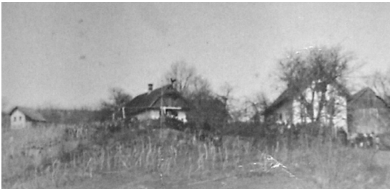
Zmazkova viničarija, kjer je bila 13.4.1944 bitka med partizani in Nemci.