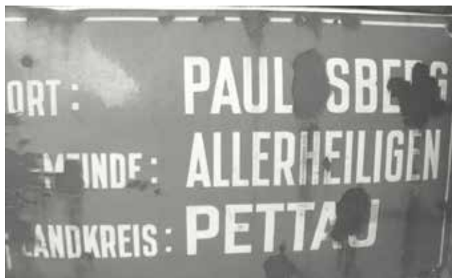
Nemška krajevna tabla Pavlovskega Vrha z navedbo kraja, občine Svetinje in okrožja Ptuj.