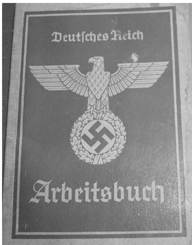
Nemška delovna knjižica.