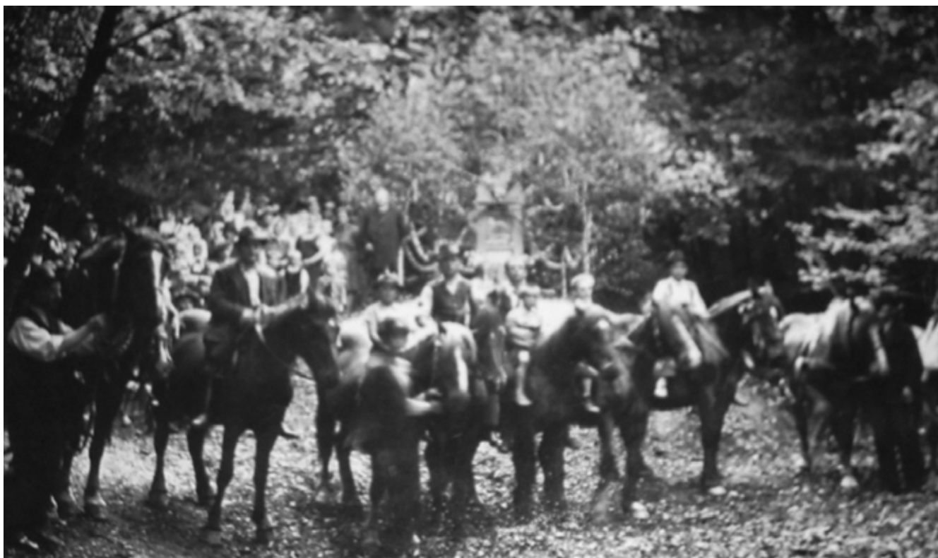
Slovesnost ob odkritju spomenika v Hočju, junija 1945.