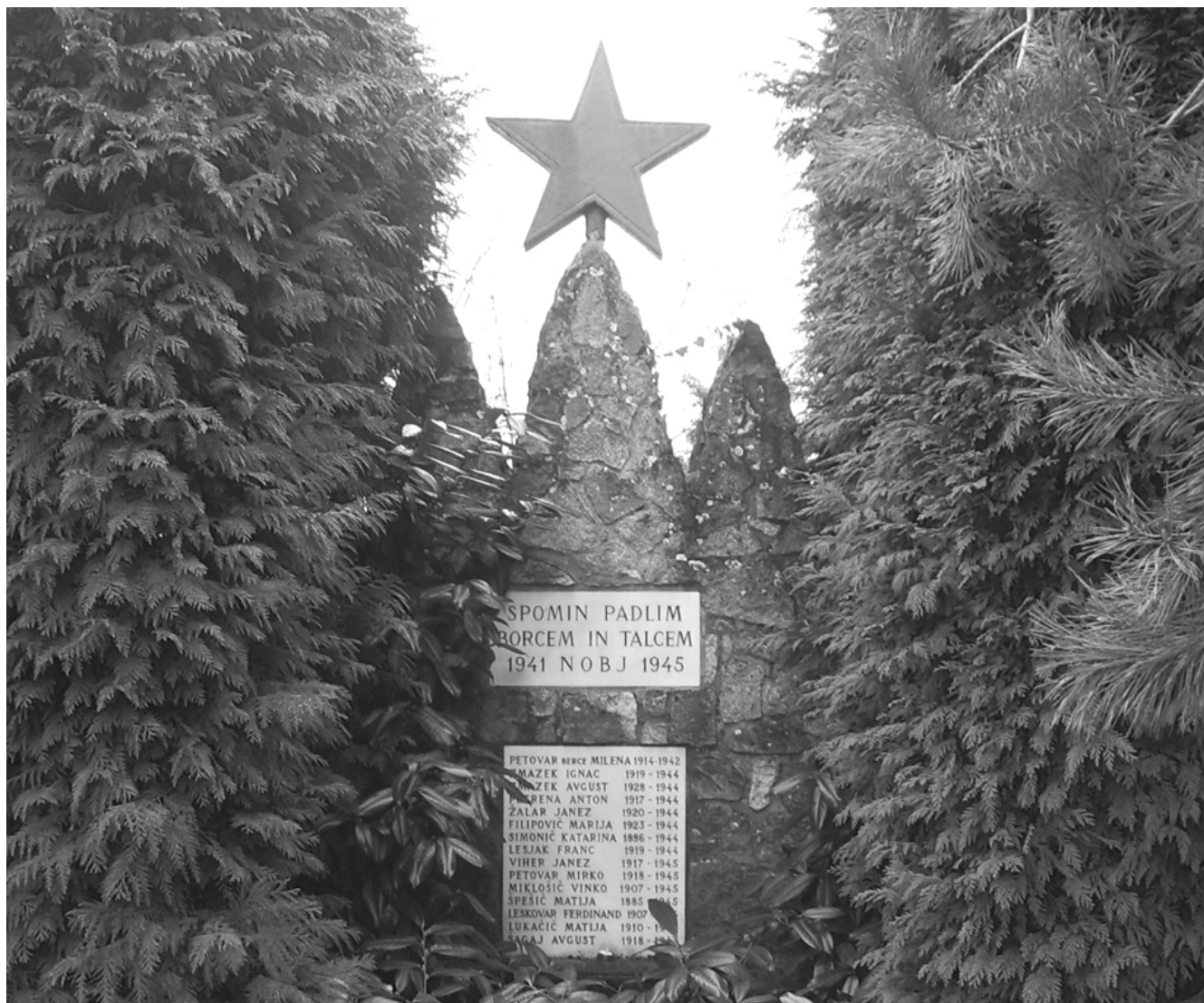
Spomenik padlim borcem in talcem pri Svetinjah.

Vsi starejši krajani, s katerimi smo imeli intervju, so bili zelo veseli osvoboditve. Vračati so se začeli ljudje, ki so bili v partizanih, begunci, izseljenci, mobiliziranci v nemško vojsko in drugi. Mnogi se s svojimi družinami niso videli več mesecev ali celo let. Najbolj veseli so bili, če so se njihovi bližnji srečno vrnili. Nadaljevali so z običajnim vaškim življenjem in delom. Veseli so bili, da so lahko v javnosti ponovno govorili slovensko, da niso živeli v strahu, kaj bo prinesla prihodnost.