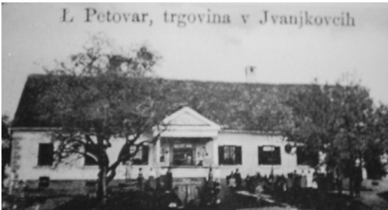
Trgovina Lovra Petovarja v Ivanjkovcih. V zgradbi je delovala tudi pošta.

pobudnik ustanovitve Prostovoljne požarne brambe v Ivanjkovcih, v dvajsetih letih je bil poslanec v skupščini Kraljevine SHS v Beogradu in dosegel, da je železniška proga od Ormoža proti Ljutomeru tekla prav skozi Ivanjkovce in ne kje drugje. 27