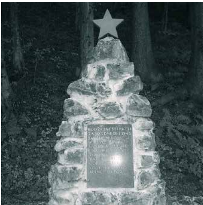
Spomenik talcem v Ivanjkovcih.

Na mestu streljanja talcev so leta 1946 postavili spomenik. Vsako leto je ob dnevu spomina na mrtve tam komemoracija, ki se je vedno udeležimo tudi učenci naše šole. Pripravimo pa tudi krajši kulturni program.