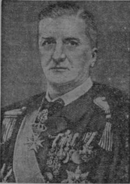
Regent Madžarske Horthy

Pogodba o »trajnem prijateljstvu« med Jugoslavijo in Madžarsko podpisana