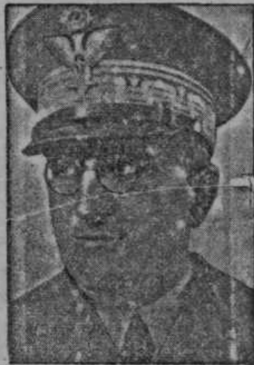
General Ugo Cavaliere, novi šef italijanskega generalnega štaba