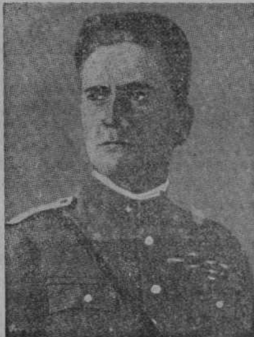
Marsal Graziani, vrhovni poveljnik vseh italijanskih čet v severnoafriški Libiji

okviru društva vršilo to in to — n. pr. tečaj, zborovanje, predavanje, poučni izlet itd. — in je članstvu razposlal vabila, je vsak član moralno dolžan, da se odzove. Saj že oliko zahteva, da moraš na vsako pismo odgovoriti, pa četudi ti ga je poslalo društvo, v katerem si vpisan kot član. Prav tako kot odgovarjaš posameznim osebam in svojim dragim, si dolžan odgovoriti na vsako vabilo društva, pri katerem si včlanjen. To je častna dolžnost vsakega člana. Ker se teh dolžnosti skoraj noben