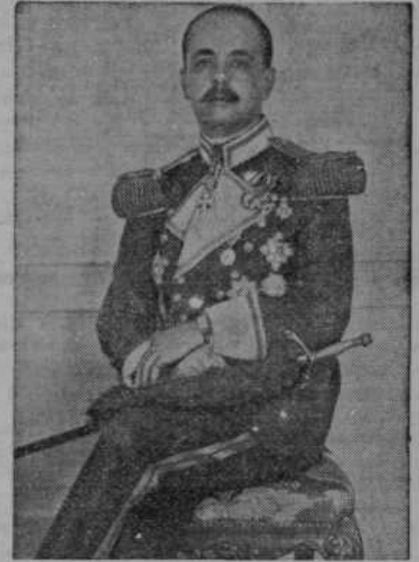
Madžarski zunanji minister grof Štefan Csaky

Jugoslovanski zunanji minister dr. Cincar Markovič bo vrnil v najkrajšem času obisk madžarskemu zunanjemu ministru v Budimpešti.