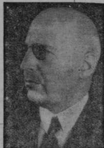
Dr. Ernest Wetter, novi predsednik Švice za 1941