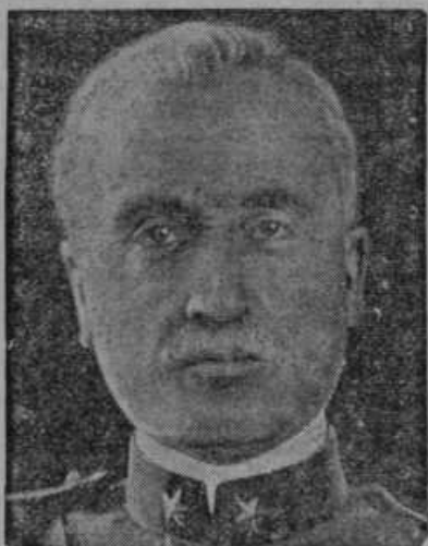
Maršal Badoglio, bivši šef italijanskega generalnega štaba, ki je pred kratkim odstopil

Ali si upate pridobiti »Slovenskemu gospodarju« vsaj enega novega naročnika?