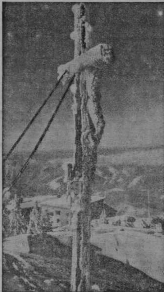
Zasneženi in ožagreni križ v visokih gorah