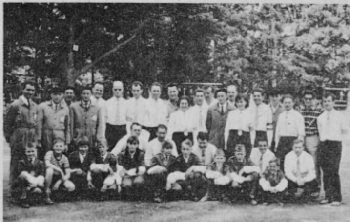
Skupna manifestacija članov AMD Poljčane in Slov. Bistrica

Da bi kar najbolje proslavili svoj jubilej, 25 letnico delovanja, je društvo pripravilo v nedeljo, 13. julija 75 svečanost, ki so jo pričeli že v jutranjih urah s povorko motornih vozil in kmetijske mehanizacije. Po povorki je bil avto rally s