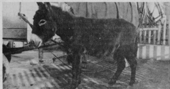
ČIČI je pri hiši samo za zabavo, čeprav lastnik Babšek pove, da so klobase iz oslovskega mesa prava poslastica...

SVET KRAJEVNE SKUPNOSTI ZAVRČ razpisuje delovno mesto