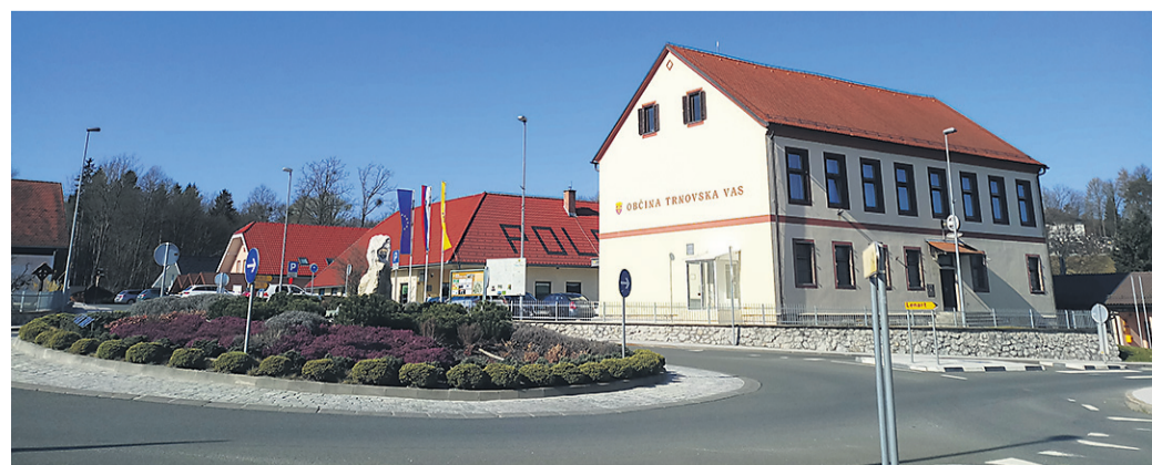
Trnovska občina bo še tri leta plačevala za izgradnjo kanalizacije v Bišu.

Hajdina • Na izredni seji o pomoči kmetom