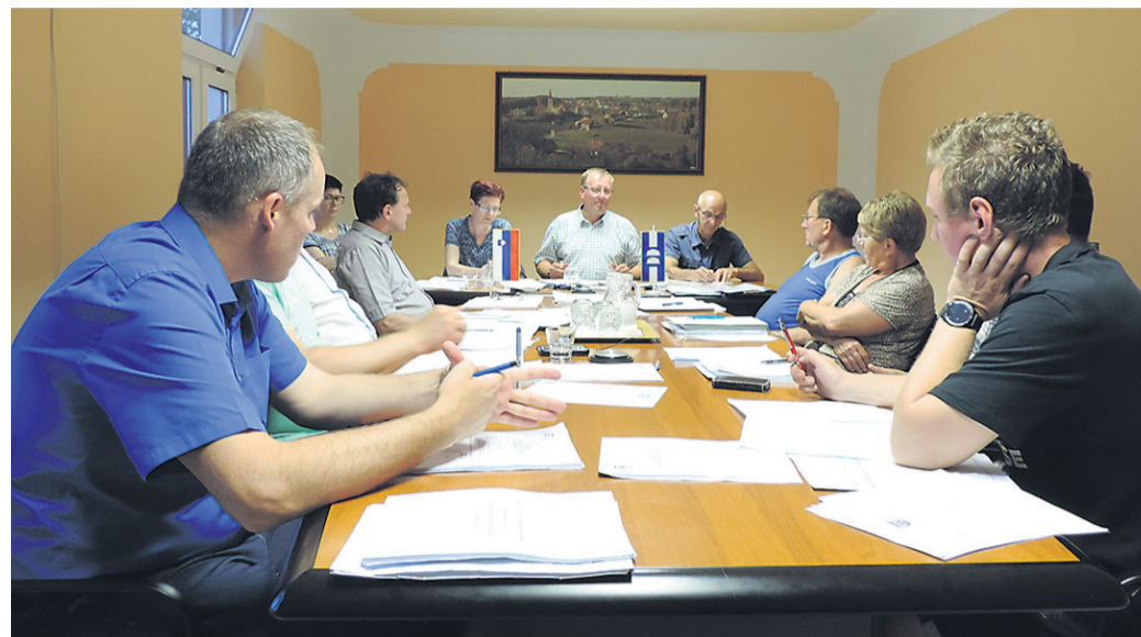
Svetniki občine Sveti Tomaž

Ob tem je župan še povedal, da v tem trenutku ne more podati vseh zneskov sofinanciranja različ-