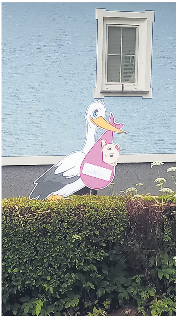
Ko dobijo dojenčka, mnogi pred hišo postavijo »štorkljo«.