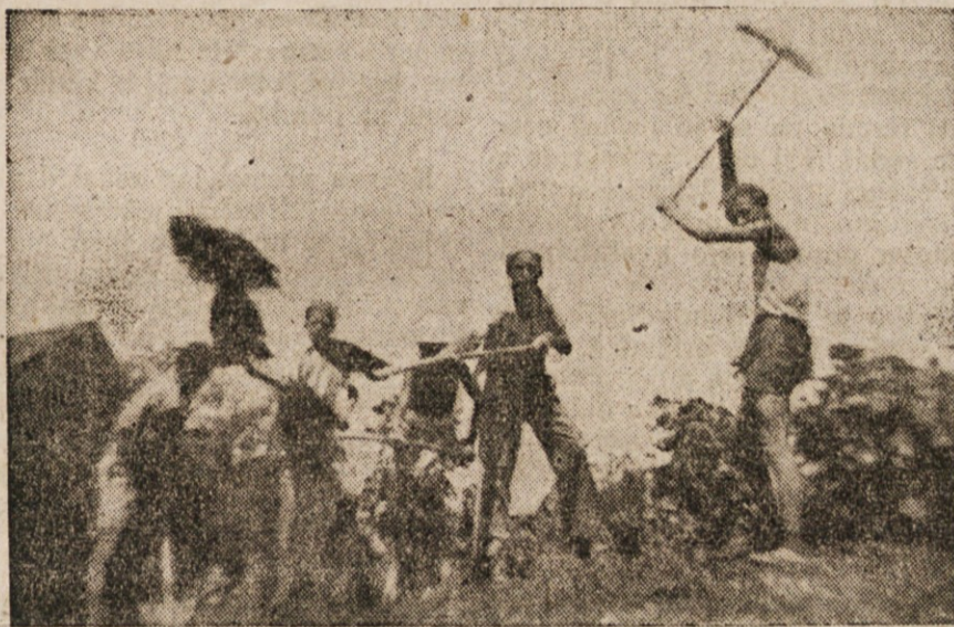
Mladina svobodne Jugoslavije gradi in ustvarja

Naša mladina je to že spoznala in se tesno strnila v Osvobodilni fronti. Tudi vnaprej bo ostala z njo tesno povezana, ker se zaveda, da bo samo v njej uresničila lahko svoje težnje in želje, ki jih naše ljudstvo že stoletja nosi v srcu. V bodoče bomo še v večji meri posvetili svoje sile trdni izgradnji naše organizacije, pa če bi se nam