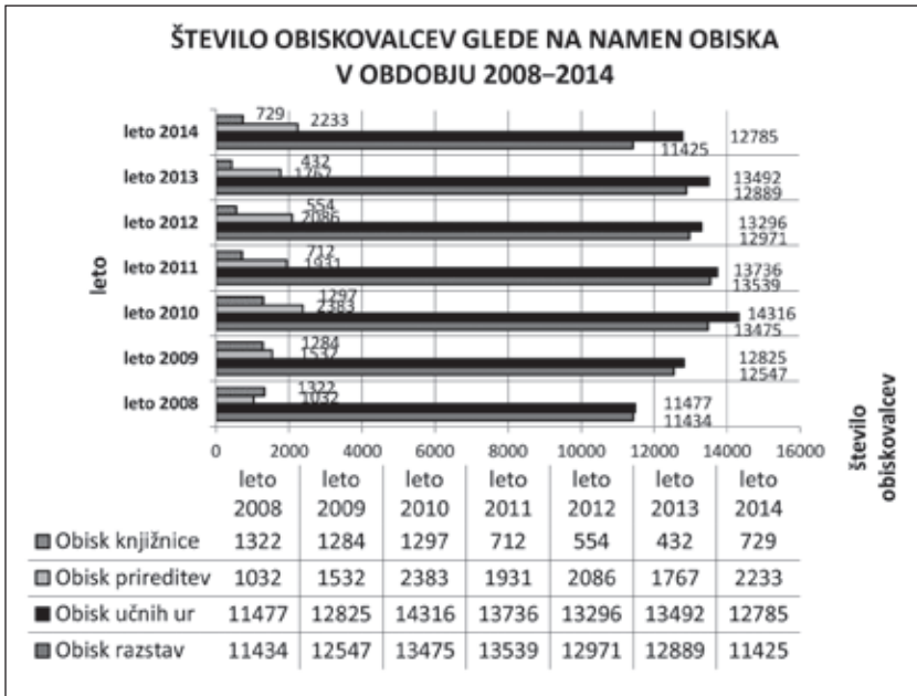
Graf: Število obiskovalcev glede na namen obiska 2008–2014

Navkljub opaznemu povečanju števila uporabnikov knjižnega gradiva v muzejski čitalnici v letu 2014 je potrebno ugotoviti, da je obisk knjižnice v daljšem časovnem obdobju precej upadel. Pri tem je treba upoštevati, da se dostopnost knjižnega gradiva z novimi vpisi v sistem Cobiss stalno izboljšuje, da je uporaba gradiva možna samo v čitalnici in da tako ni izposoje gradiva na dom. Muzejska čitalnica je zato v veliki meri predvsem študijski prostor. V statistiki obiska v knjižnici v zadnjih sedmih letih je treba upoštevati tudi dejstvo, da se je z menjavo bibliotekarke zaostril tudi bolj dosleden način beleženja obiska. Muzejska čitalnica ne služi samo kot študijski prostor, ampak tudi kot glavni prireditveni prostor, v katerem potekajo praktično vsi večji muzejski dogodki oz. muzejske prireditve. Število obiskovalcev se na njih od leta do leta zelo spreminja in nasploh so za obisk prireditev značilna velika nihanja. Odvisna so od števila prireditev in dogodkov v posameznem letu, ti pa od sredstev, s katerimi muzej v posameznem letu razpolaga. Obisk učnih ur je med obravnavanim obdobjem veskozi večji od obiska razstav. Razlika med njima je v letu 2014 največja, kar pomeni, da se je med skupinami obiskovalcev, ki v muzeju obiskujejo razstave in učne ure, povečal delež tistih, ki pridejo samo na učne ure. Obisk učnih ur in razstav je veskozi daleč nad obiskom prireditev in knjižnice. Zaradi narave dela v muzeju je ta pokazatelj povsem razumljiv. Nedvomno imajo učne ure