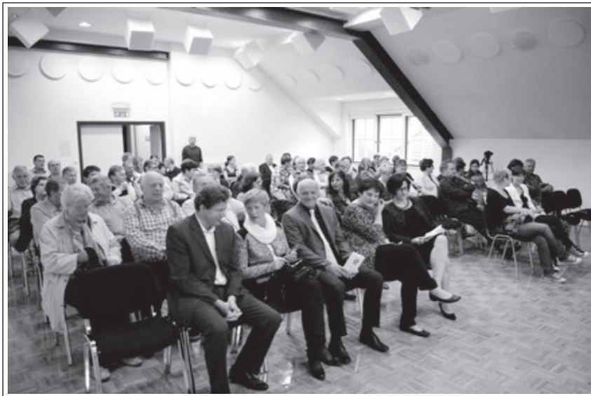
Odprtje Razstave Z vrlino in delom, 30. september 2014, Cerklje (hrani SŠM, fototeka, foto: M. Javoršek).