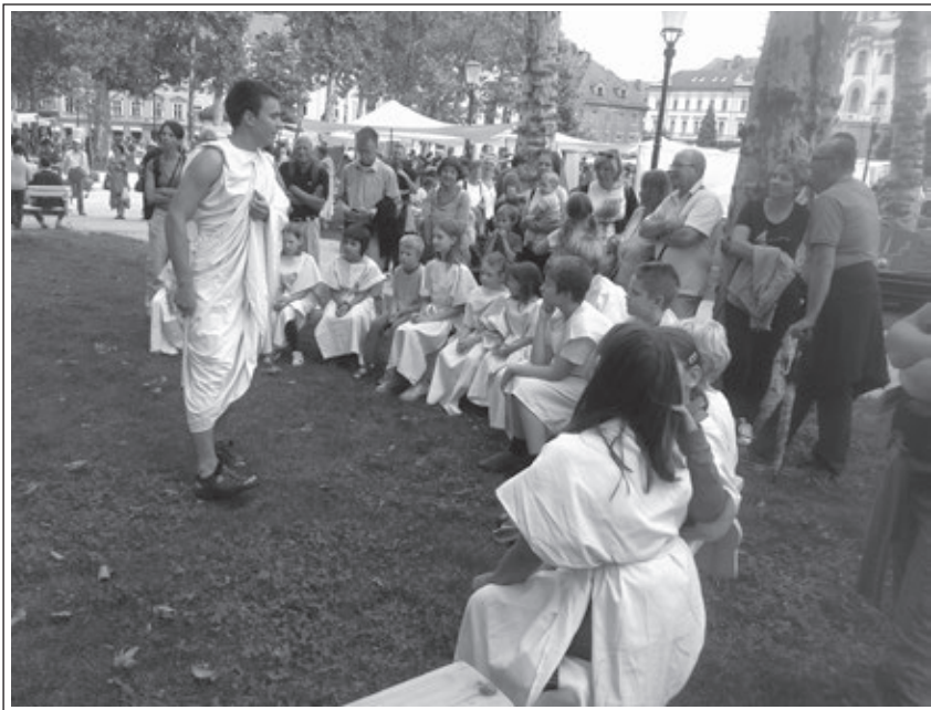
Ave Emona, Park Zvezda, 22. avgust 2014.

sodelovali učenci OŠ Prežihov Voranc, ki so se učili latinskega jezika. Prava premierna izvedba je bila 21. junija 2014 na Poletno muzejsko noč. V samostanskem atriju v neposredni sosesčini muzeja sta bili kar dve izvedbi z več kot 100 udeleženci. Na osrednji prireditvi 2000-letnice ustanovitve mesta Ave Emona, ki je bila od 22. do 24. avgusta 2014 na Kongresnem trgu, so vse tri dni potekale tudi Učne ure iz antične Emone. Prispevek Slovenskega šolskega muzeja na prireditvi je pokazala tudi televizija. Prva Učna ura iz antične Emone v redni muzejski ponudbi je bila 5. septembra 2014, do konca leta pa se jih je zvrstilo še enajst.