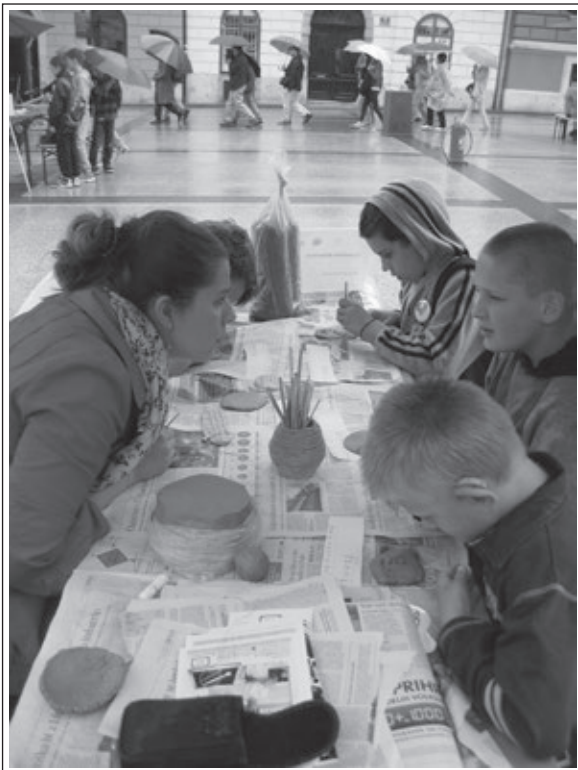
Festival Igraj se z mano, Sumerska delavnica, 28. maj 2014.

v prostorih muzeja med šolskim letom, med počitniškimi programi, na dnevih odprtih vrat in na prve sobote v mesecu. Izvajala je Rimsko in Sumersko delavnico, Delavnico vezenja in Zvončke, v pomoč pa je bila tudi pri izvajanju likovnih delavnic. Zunaj muzeja je Delavnico vezenja izvedla 26. marca 2014 na Kulturnem bazarju, Sumersko delavnico pa na 8. mednarodnem festivalu »Igraj se z mano« 28. maja 2014.