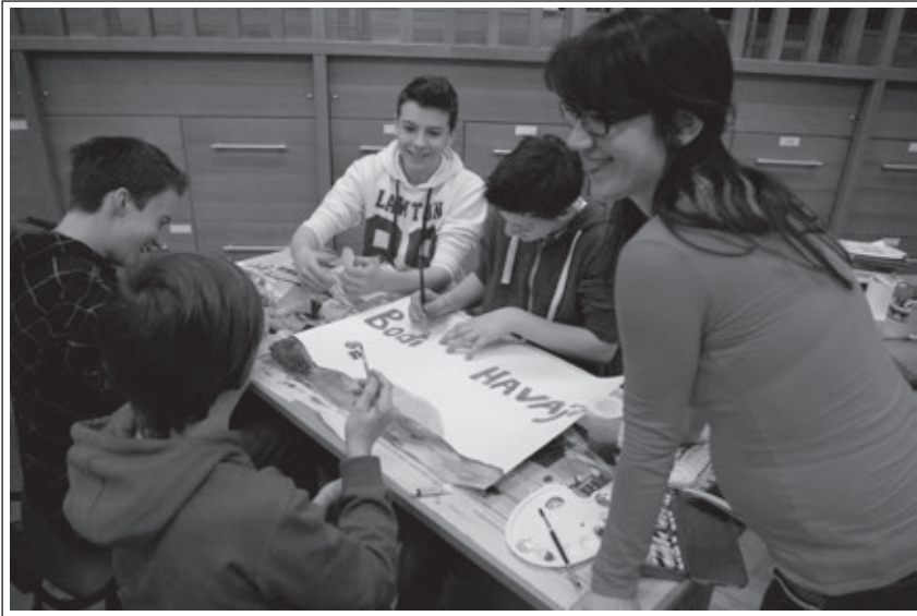
Delavnica oglasa, 6. marec 2014.