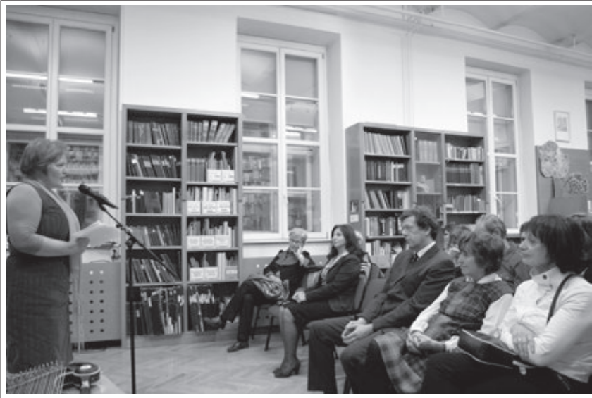
Odprte razstave Učilnica v naravi, šolski vrt včeraj, danes, jutri, 20. november 2014.