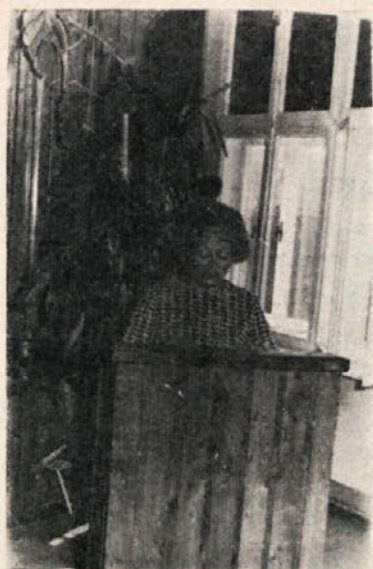
V počastitev dneva žena je osnovna organizacija sindikata priredila slavnostno akademijo v sindikalni dvorani naše organizacije združenega dela.

— Ne vem, tovariš učitelj, lahko pa vprašate mojo sestro. Ona gotovo ve, ker ji vedno mama pravi, če boš počenjla take stvari, boš nekega dne privlekla pamzla domov.