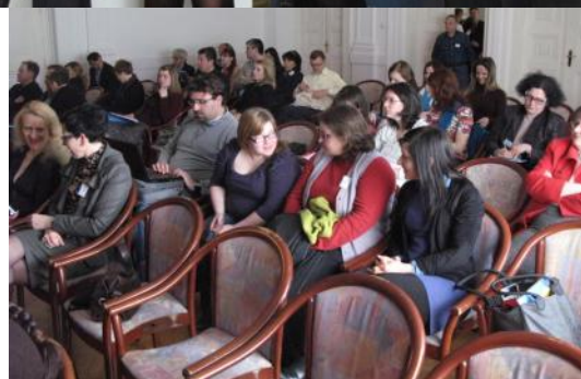
Desno: obiskovalci konference.