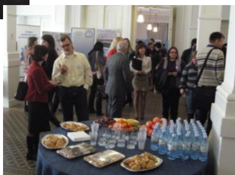
Desno: udeleženci konference med odmorom.