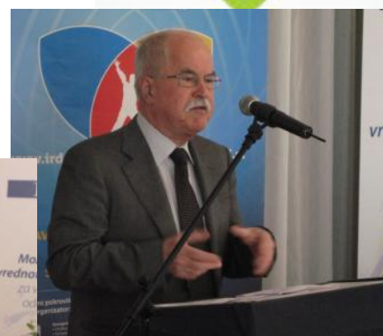
Zgoraj: dr. Boštjan Žekš, minister za Slovence v zamejstvu in po svetu.