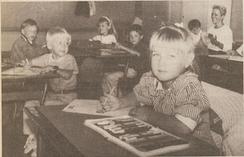
Malčki v prvem razredu osnovne šole "Oton Župančič"

Čeprav poletje še ni mimo in je vreme v teh dneh skoraj bolj vroče kot avgusta, pa se je za otroke in številne mladostnike čas počitnic končal. Včeraj se je namreč svečano ali bolj zbrano — odvisno pač od oblike, ki so jo izbrala posamezna ravnateljstva — ponovno začel pouk. Tradicionalno šolsko mašo, ki je za marsikaterega učenca pomenila nekoč pravi začetek pouka, so imeli včeraj le na redkih šolah, kot na primer na višjih srednjih šolah. Na večini šol so namreč sklenili, da mašo priredijo pred uradnim začetkom pouka ali po njem.