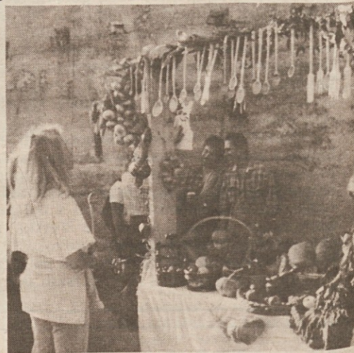
Z lanskega sejma v Gročani

Razstavo-sejem, ki je že lani, ob prvi izvedbi, doživela res velik uspeh, bodo odprli jutri ob 15. uri, zvečer pa bo na vrsti ples z ansambлом TAIMS. V nedeljo bodo sejem odprli že ob 9. zjutraj, popoldne ob 15. uri pa bo uradni del priredit-