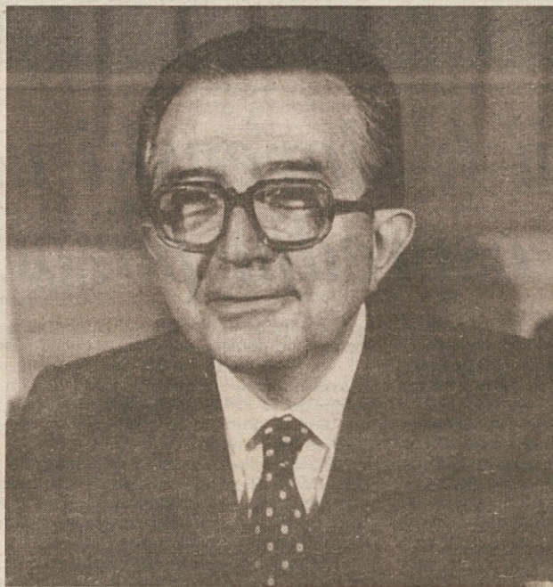
Ministrski predsednik Giulio Andreotti