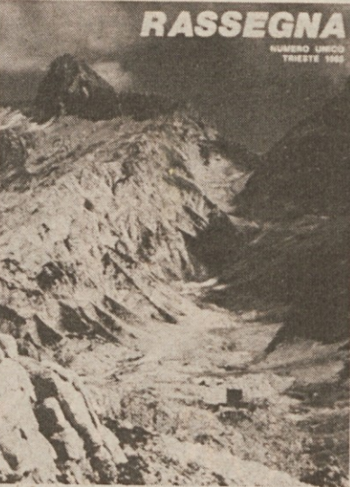
Naslovnica zbornika tržaške jammerske federacije