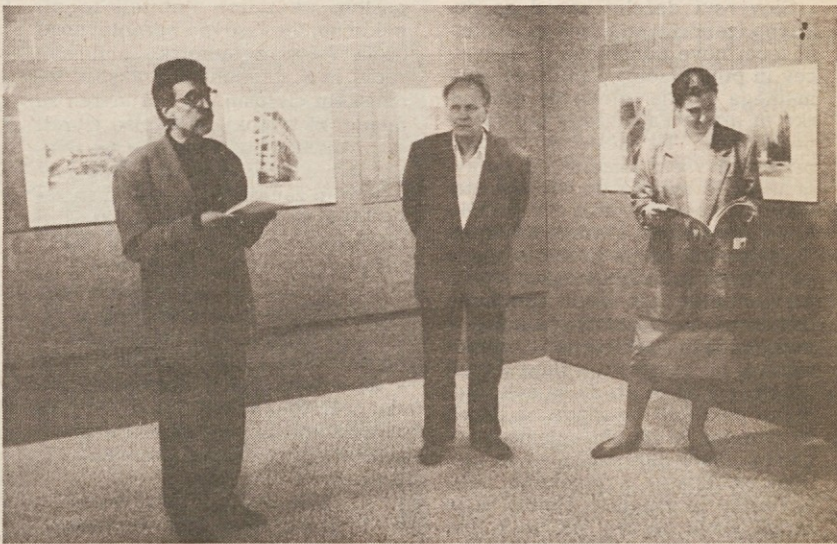
Posnetek s sinočnje otvoritve