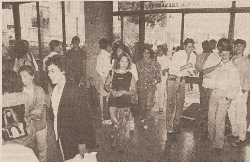
Nasmejani obrazi na liceju "Prešeren"

Če za osnovno šolo obstajajo novi učni načrti, na višjih srednjih šolah čakajo reformo že dvajset let. Edina možnost, da se nekoliko posodobijo pouk, je uvajanje eksperimentiranja. K sreči se slovenske višje srednje šole usmerjajo po tej poti, najbolj korenit preobrat pa bodo letos doživeli na učiteljski, kjer uvajajo novo petletno pedagoško smer.