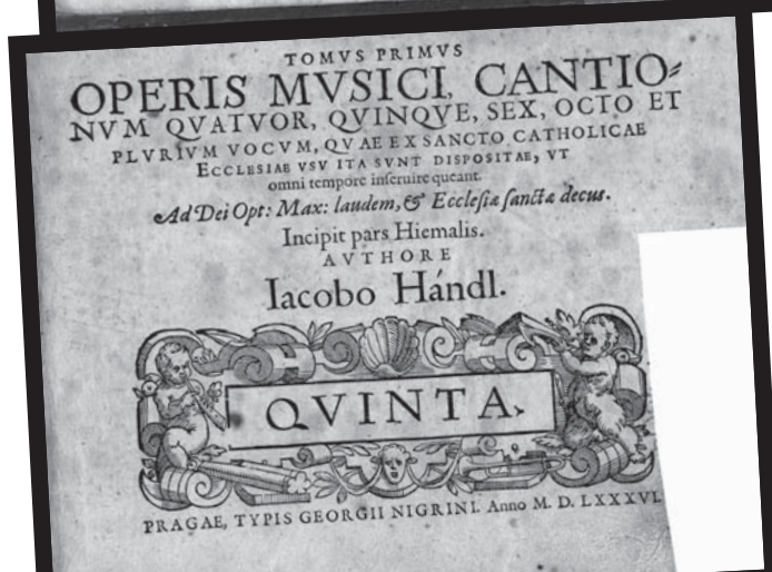
Jacobus Handl Gallus, Opus musicum, naslovnica in 1. str. tiskane prve knjige - tenorski part moteta Pater noster iz zbirke motetov (Praga, 1586; orig. hrani NUK - Glasbena zbirka, Ljubljana; objavljeno z dovoljenjem)

skladatelje in določala slogovno orientacijo slovenske ljudske glasbe in cerkvenih pesmaric na začetku druge polovice 18. stoletja. Ta se kaže tudi v preprosti melodiki. Academia Philharmonicorum je bila prva ustanova te vrste zunaj romanskega in anglosaškega evropskega prostora.