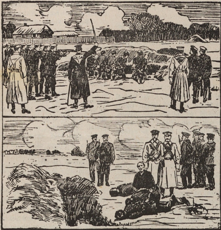
Ustreljenje ruskih upornikov.