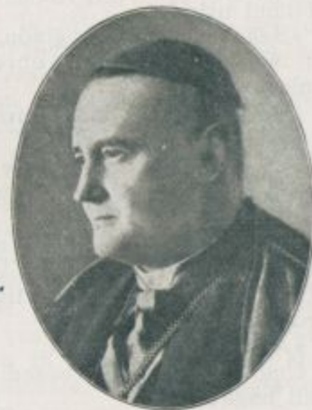
Novi praški nadškof grof Huyn.

bi dajala veliko večje polje, pravzaprav vodno gladino, za delovanje; in res je dosegel na površini s hitrostjo 12 vozlov v celem 470 km, s hitrostjo 8 vozlov 1100 km. V potopljenem stanju je prevozil seveda