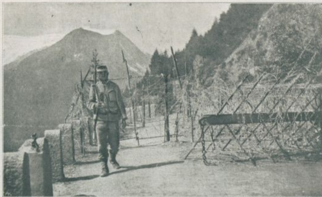
Na straži gorskih prelazov v tirolskih alpah.

Šel sem hitro in nemirno, vsak hip sem pričakoval, da me pozove stotnik nazaj. Nazaj ozreti se nisem hotel, ker se ne bi rad srečal s stotnikovim pogledom, ki bo odkril naš po prepovedanem potu pridobljen plen.