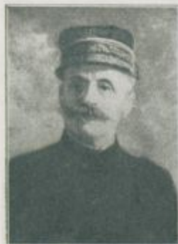
General Foch, francoski voditelj angleško-francoske ofenzive.

se pridruži Rusiji ali Avstriji. Tretje leto že Rumuni omahujejo na dve strani, delajo z obema izvrstne kupčije, spravljajo zlato in čuvajo svojo armado, arzenale in magazine za živila, toda ura odločitve je tudi zanje prišla; tudi Rumuni morajo na bojišče, ako hočejo biti deležni sadov miru. — Kako da se odločijo, pač ne vemo, vendar naši so na vse pripravljeni, tako da bi jih tudi ne presenetil novi sovražnik iz tega kota. — Rusi hočejo na vsak način skozi Rumunijo vdreti na Sedmograško in poskušajo tudi, kako bi napadli Bolgare. V kratkem času se bodo na tem bojišču doigrale važne stvari.