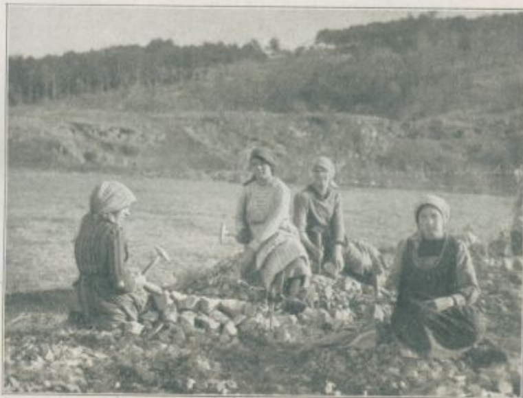
Slike iz Komna: Dekleta tolčejo kamenje za gramoz, ker ni moških doma.