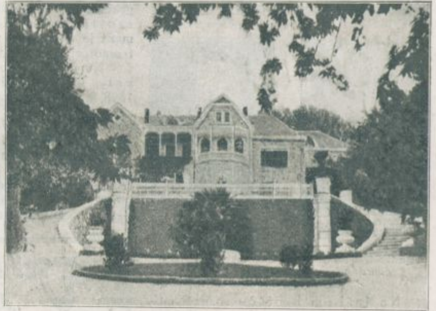
Grškega kralja grad Tatoi, ki je nedavno pogorel.

Težke dneve sedaj preživlja naš narod posebno na Goriškem in v Primorju, kjer je sosed z našim stoletnim laškim sovražnikom. Že spočetka jih je moralo mnogo bežati s svoje domače zemlje in zopet sedaj, ko so morali naši po nadčloveških naporih začasno sovražniku pre-