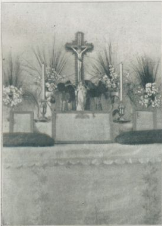
Slike iz Komna: Oltar v bolnici.

»Veš Ive, prazaprav moraš biti ti še najbolj vesel! Boš vsaj zopet enkrat mesar kakor doma!«