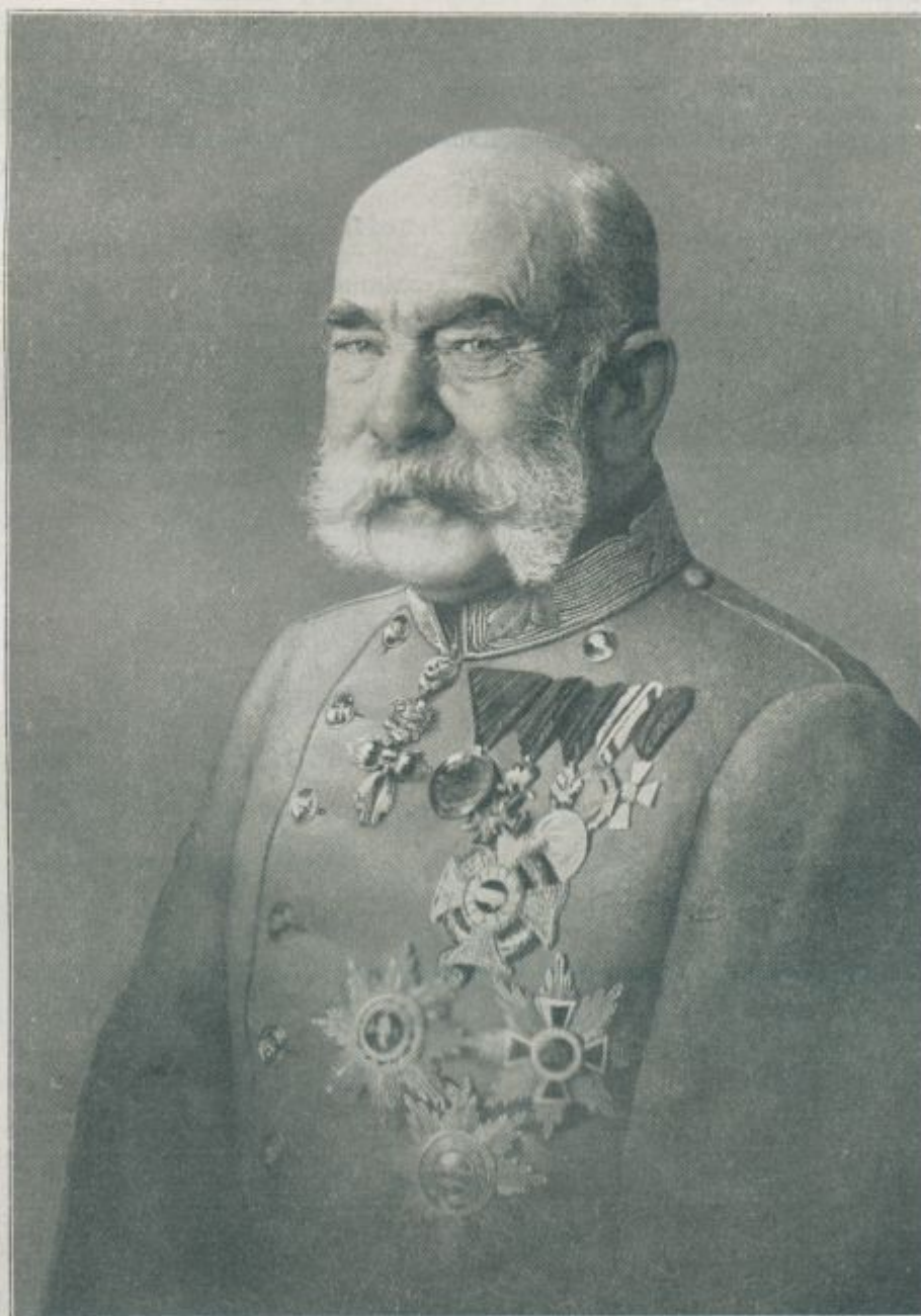
Cesar Franc Jožef I. ob 86 letnici rojstva.

LETNIK 2. * 24. AVGUSTA 1916 - IZHAJA VSAK ČETRTEK * ŠTEV. 52