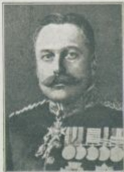
General Haig, angleški vojskovodja angleško-franc. ofenzive proti Nemcem.

Na laškem bojišču so naši morali sovražniku prepustiti Gorico, ali pravzaprav njene razvaline. Bili so grozni boji večdnevni in tako strašni, kakršnih tudi Goričani ne pomnijo, dasi so zadnje leto v tem pogledu precej poskusili laško premoč posebno v topništvu je odločila zmago. Sedaj se Lah bori okrog Gorice za vsako ped zemlje, ki jo naši branijo kakor levi. Trdno smo uverjeni, da pomnoženi naši armadni zbori na laški fronti zopet Lahu pokažejo pot nazaj, proč od naše Vipave, proč od našega Trsta. — Naša mornarica prav pridno pomaga armadi. Dan na dan napravlja izlete s svojimi morskimi letali v sovražnikova mesta in povzroča neprijatelju veliko škode.