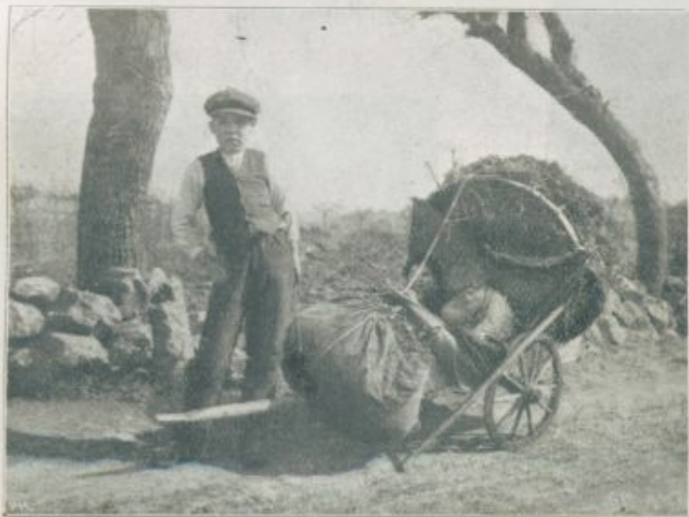
Slike iz Komna: Otroci vozijo pozimi listje domov — zanje ni vojske.

bi se namreč splazila kaka manjša sovražna patrolja tu skozi in nam postala neprijetna. S stotnikovim daljnogledom sem mogel zapaziti vsako premikanje daleč naokoli, sedaj sem ga že odložil, zakaj oči so me že pekle, in lahna megla, ki je začela padati na vrhove dreves, je zastirala pogled. Vsak čas se je moralo zvečeriti, z večerom je naša današnja naloga končana. Vrnemo se nazaj v tabor, kjer je stotinja v rezervi, in dobimo menažo.