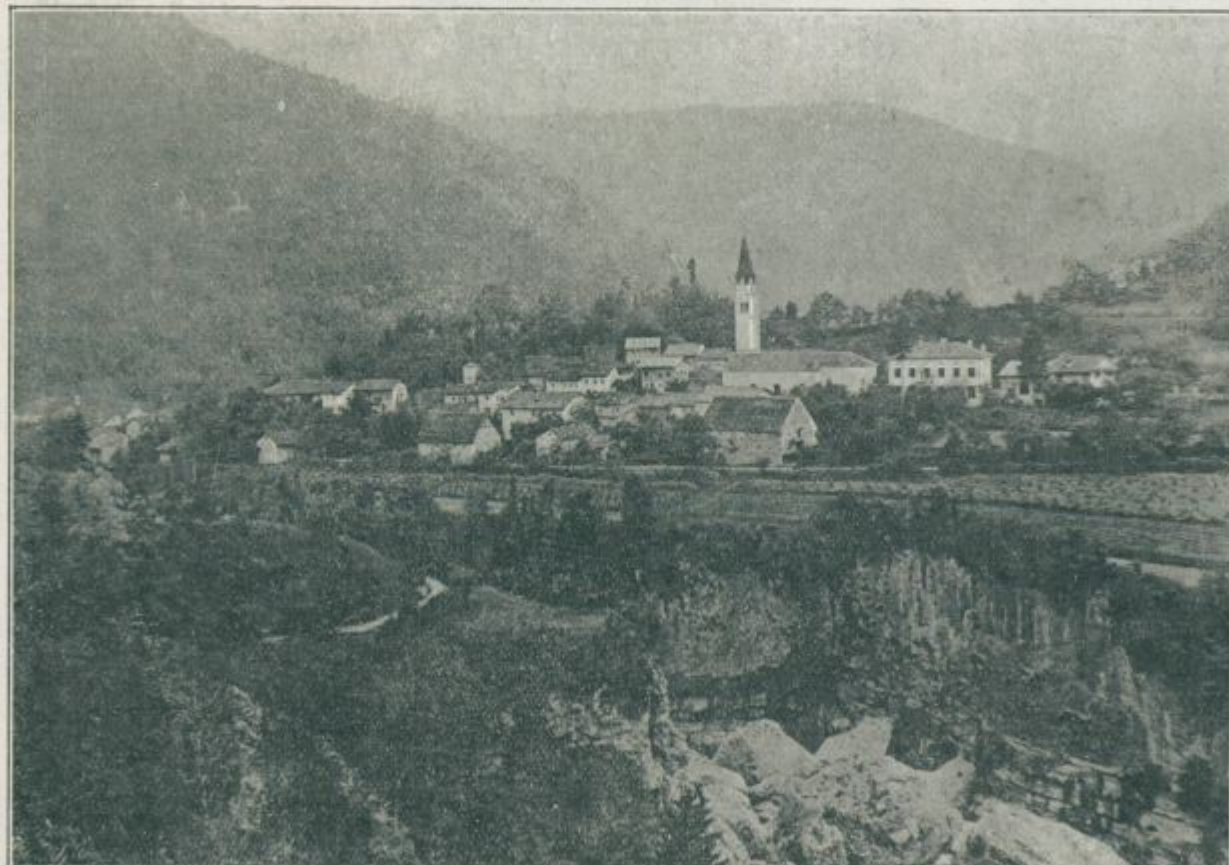
Sv. Lucija ob Soči, ena prvih točk, ki so jih Lahí »na piko« vzeli.

Grmenje salv iz pušk prekaša celo bobnenje topov . . . Zopet vstajajo sve-