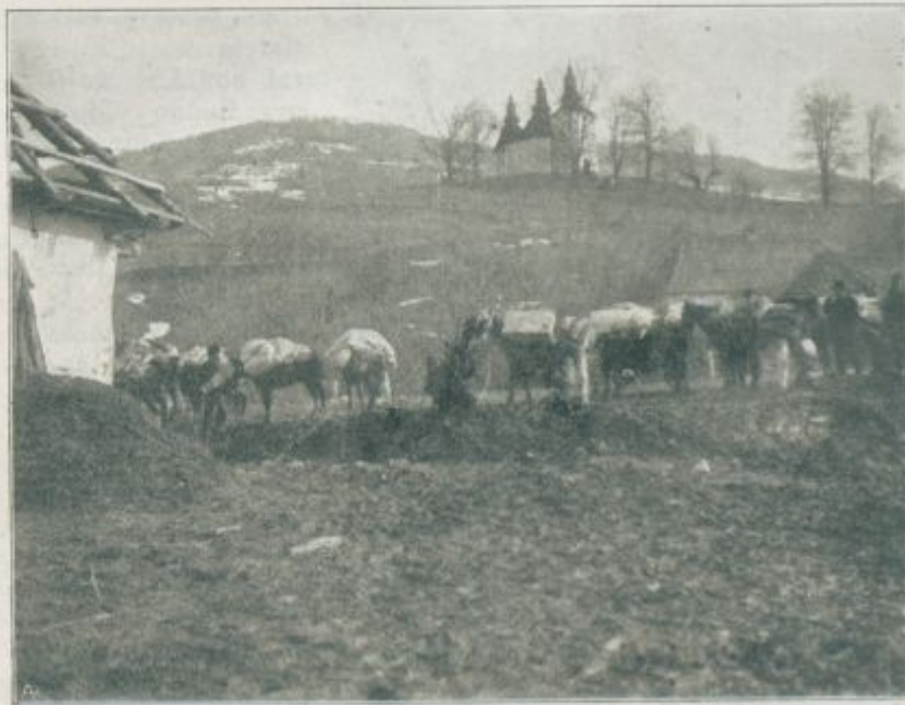
Prizor iz Karpatov.

»Saj pazim, ali vseeno mislim, da bi bilo dobro, če bi poslali Marka še enkrat po slive! Slive so za glad in za žejo!«