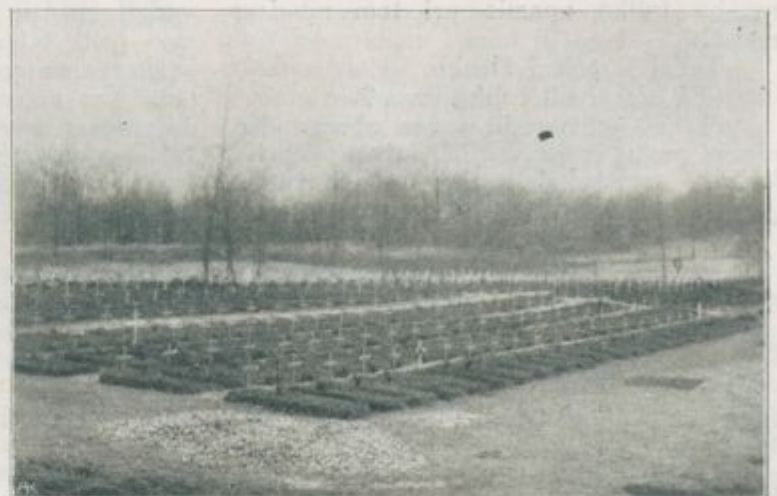
Slike iz Komna: Vojaško pokopališče.