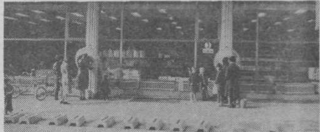
Telefonski govornici pred Namo sta vedno zasedeni

Pa smo pri vzdrževanju govornic, ki so kar prepogosto pokvarjene. Od 276 javnih telefonskih govornic PTT podjetja Ljubljana jih je na področju mesta čez 200 in prav te so najpogostejša tarča izživljanja posameznikov. Če pogledamo žalostno statistiko poškodb, ki smo jih zabeležili do septembra in ki že prekašajo število poškodb v lanskem letu, moramo povedati, da je bilo letos odnesenih že 37 slušalk (lani 33), ukradena je bila kasetna z denarjem, dva medkrajniva telefonska aparata sta bila močno poškodovana, dve govornici povsem uničeni, trije dušilniki pa so zgoreli. Telefonskih imenikov bi nam se-