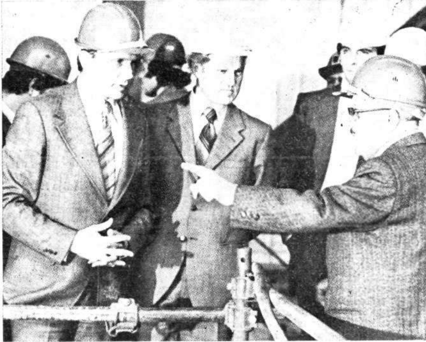
Edvard Kardelj na obisku v Nuklearni elektrarni Krško — 1977