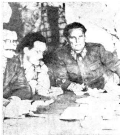
Soborca J. Broz-Tito in E. Kardelj v votlini na Visu — 1944

Iz knjige »Problemi socialistične politike na vasi«, 1959