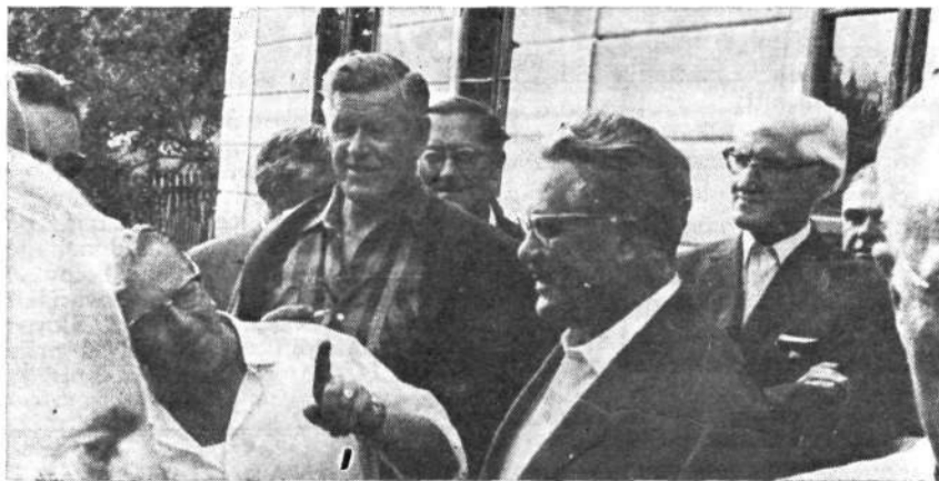
Edvard Kardelj med sošolci na Raki