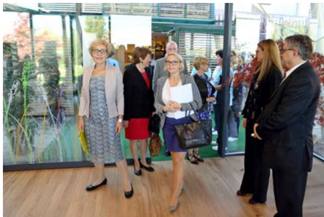
Slovesnosti v Muretincih se je udeležila tudi ministrica za delo, družino, socialne zadeve in enake možnosti dr. Anja Kopač Mrak.