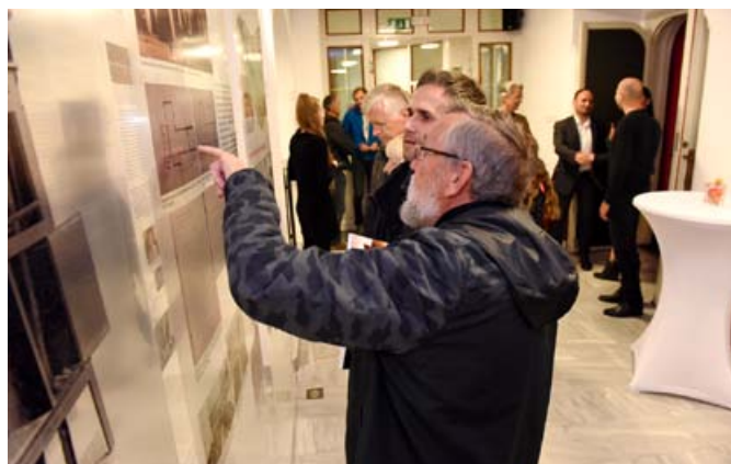
V prostorih Mestnega kina Ptuj je na ogled zanimiva pregledna razstava o kinematografiji na Ptuju.