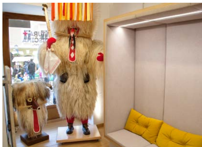
Na svoj račun pridejo tudi najmlajši, ki z zanimanjem potipajo kurentove brke in kožuh.

Celovita prenova TIC Ptuj je prinesla tudi razširitev prodajnega programa spominkov pod geslom 365 dni zgodovine/365 days of history. Novost v ponudbi so tudi izbrana vrhunska vina ptujskih vinarjev.