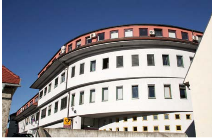
Okrajno sodišče na Ptujju je na Vodnikovi ulici.