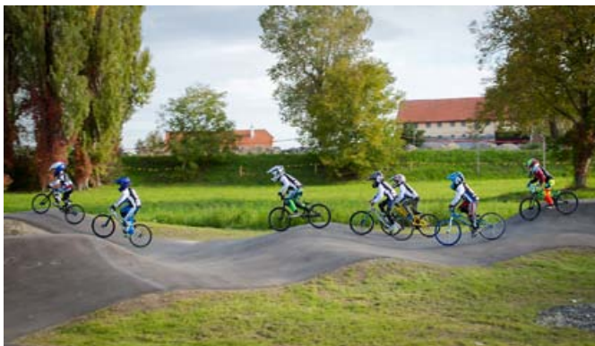
Vsem želimo aktivno in varno uporabo steze!