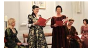
V. KLOŠTRSKI VEČER