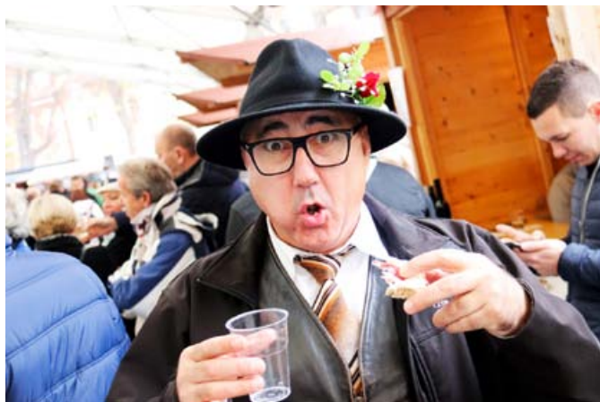
Dan za veselje, pa tudi spoštovanje tradicije