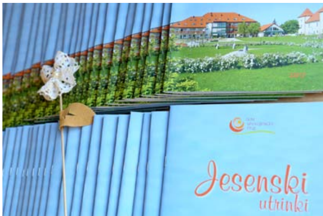
Publikacija ptujskega doma upokojencev, na naslovnici enota v Muretincih.