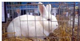
RAZSTAVA MALIH PASEMSKIH ŽIVALI PTUJ 2017

(podrobneje na https://discoverptuj.eu/ )