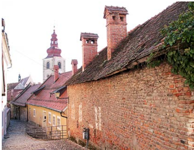
Za redno vzdrževanje kurilnih naprav so odgovorni uporabniki.

Z menjavo letnih časov se moramo prilagoditi novemu obdobju, a če ne upoštevamo zakonitosti in dejavnikov časa, tvegamo svojo varnost. Tem spremembam je prilagojeno tudi bivanje in z njim zagotavljanje pogojev za varen in topel dom. Pred nami je nova kurilna sezona, s tem pa tudi novi izzivi lastnikov, kako se bomo odzvali na zimski čas.