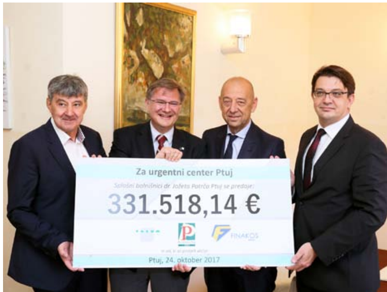
Predaja sredstev, zbranih za urgentni center na Ptuj