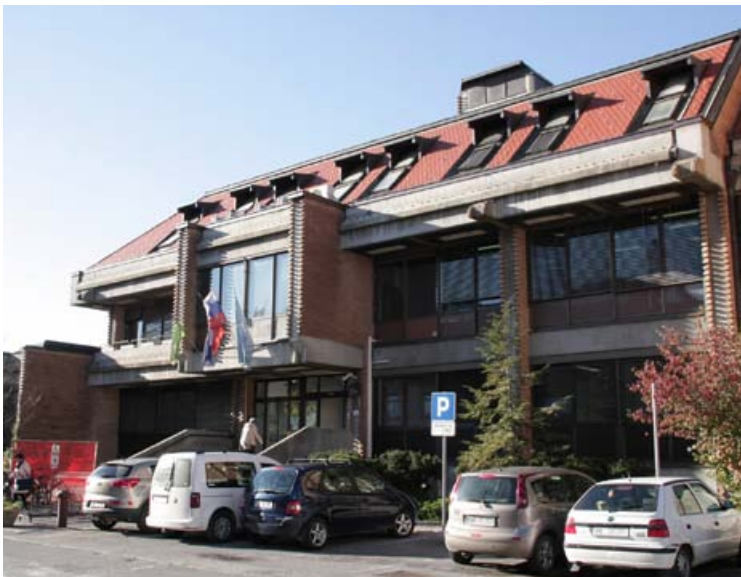
Finančni urad Ptuj ima sedež na Trstenjakovi ulici.