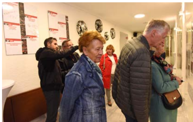
Razstavo si bo v kinu moč ogledati do konca leta, od januarja 2018 pa se seli v prostore Zgodovinskega arhiva na Ptuju.