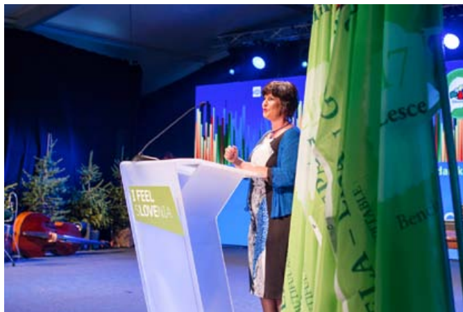
Eva Štravs Podlogar, državna sekretarka na Ministrstvu za gospodarski razvoj in tehnologijo