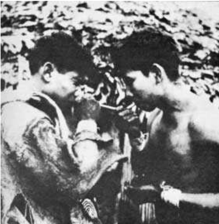
Amazonka Indijanca vdihujeta DMT. Iz knjige R. F. Schultesa, Where the Gods Reign (London, Synergetic Press, 1985)

Vidimo ju kot nerešljiv dualizem zaradi slabe kakovosti kodov, ki jih običajno uporabljamo. Problem jezika je, da ima