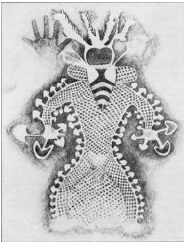
Gobji šaman s čebeljim obrazom iz Tassili-n-Ajjerja. Risba: Kat-Harrison-McKenna. Ilustracija iz knjige O. T. Ossa in O. N. Oerica, Psilocybin: The Magic Mushroom Grover's Guide , 1986, str. 71, narejena po izvorniku iz knjige Jean-Dominique Lajoux, The Rock Paintings of the Tassili (New York: World Publishing, 1963).

umiranja. Ne gre za to, da bi bili obsojeni na večno življenje. Lahko si ga skazimo s svojo nevednostjo.