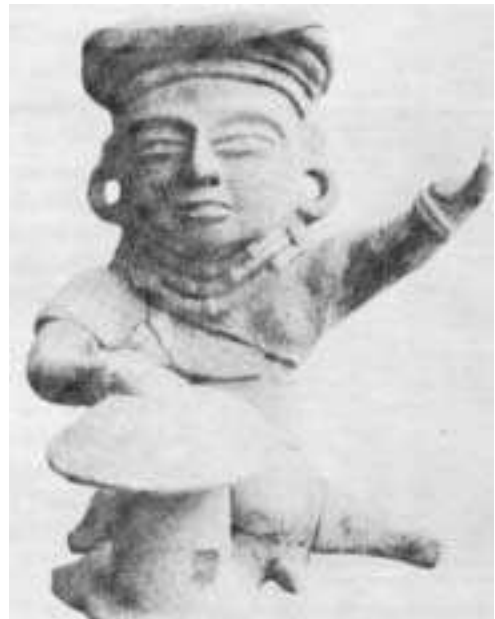
2000 let star gobji kamen iz Mehike.

Vedno, ko telo sprejme novo spojino, morate biti previdni in dobro obveščeni o možnih stranskih učinkih. Izurjeni psihedelični raziskovalci se tega dobro zavedajo in odprto priznavajo, da je najpomembneje biti dobro obveščen.