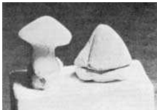
Zeleni kamniti skulpturi gob z najdišča pri Vinči. Iz knjige Marije Gimbutas, The Goddesses and Gods of Old Europe (Berkeley, University of California Press, 1982).

celotne vrste zgolj z močjo informacije, ki prihaja skozenj. Psilocibin je izvor gnoze. Njen glas pa je v zahodni misli neslišen vsaj 1000 let.