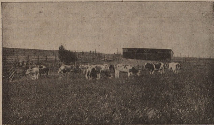
Del pašnika za starejšo živino v Friedlandu na Češkem. Spredaj bogata ruša, zadaj staje z ograjami in živino.

Na svojem poučnem potovanju po Češkem in po Nemčiji sem si ogledal tako urejene pašnike v Friedlandu na Češkem in po Saksonskem. Med drugimi