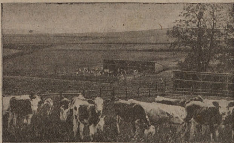
Del pašnika za mlado goved v Friedlandu na Češkem. V ozadju staje. Bogata pašna ruša.

nole pašna živina, imamo sedaj po raz- nih krajih skrbno negovane in umelno nasejane pašnike, ki se po vseh pravilih novodobnega pašništva oskrbujejo in