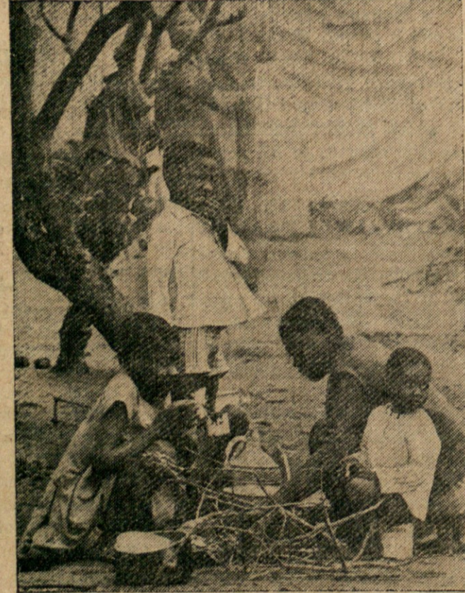
V ANGOLI VOJNE SE NI KONEC — V večjem delu Angole se nasprotniki marksistične vlade še vedno upirajo in vodijo boj za demokratično državen red. Ljudje bežijo preko meje v Zambijo, kjer so za begunce uredili posebna taborišča. Na sliki vidimo begunsko družino v taborišču, ko pripravlja jed.