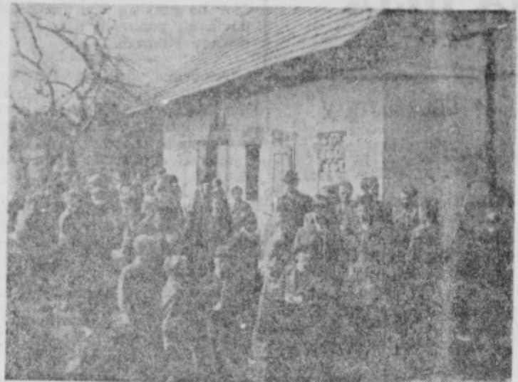
Ta hiša bo odslej pod varstvom kulturnih spomenikov. V njej bo obnovljen bunker prehodne bolnice in urejen krajni muzej NOV.

V Sagadinovi hiši v Srecah pri Makolah je bila od leta 1941 dalje partizanska javka, pozneje pa tudi prehodna bolnica. V noči od 12. na 13. aprila 1945 so lastiši hišo obkolili, 3 žive ujeli, jih 13. aprila privežali na kljuko vrat, polili z bencinom štiri žrtve pa so padle v bunker ju pod gorečo hišo.