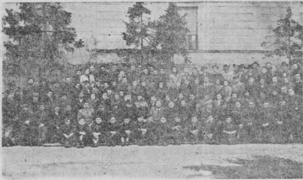
Motiv s prejšnje ga obnove zbora

Zelo plodna je bila diskusija o predlogih glede bodočega tekmovanja med sektorji, pregledu članskih vrst glede pripadnosti organizacijam, o seminarjih po sektorjih, o tehnični usposobitvi strojnikov, o konzultacijah častnikov in podčastnikov, o gasilskih praporih iz predaprilske Jugoslavije, o pristopanju mladine v gasilska