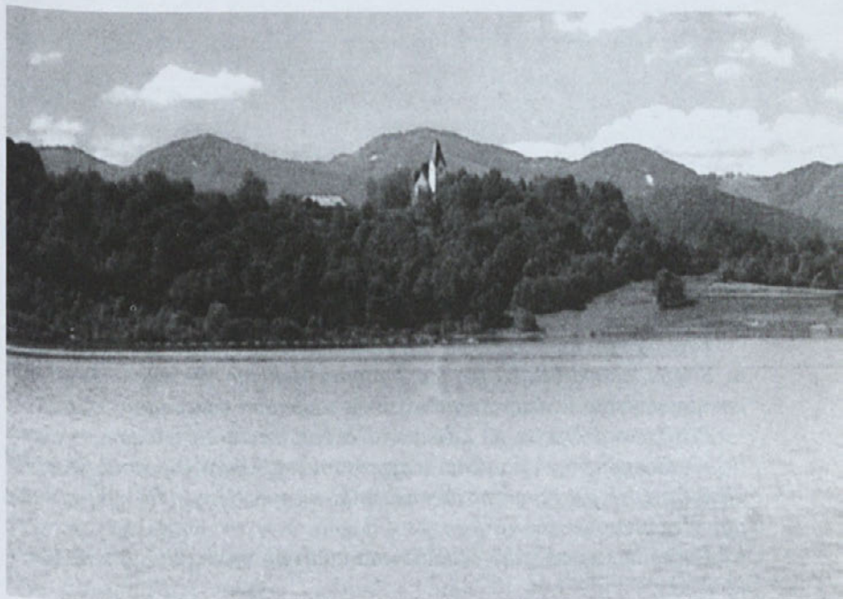
Teharje - potopljeno taborišče

Da, križ ste vrgli med smeti! A križ - nosimo mi!