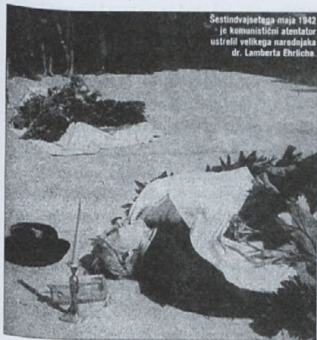
Šestindvajsetega maja 1942 je komunistični atentator ustrelil velikega narodnjaka dr. Lamberta Ehrlicha.