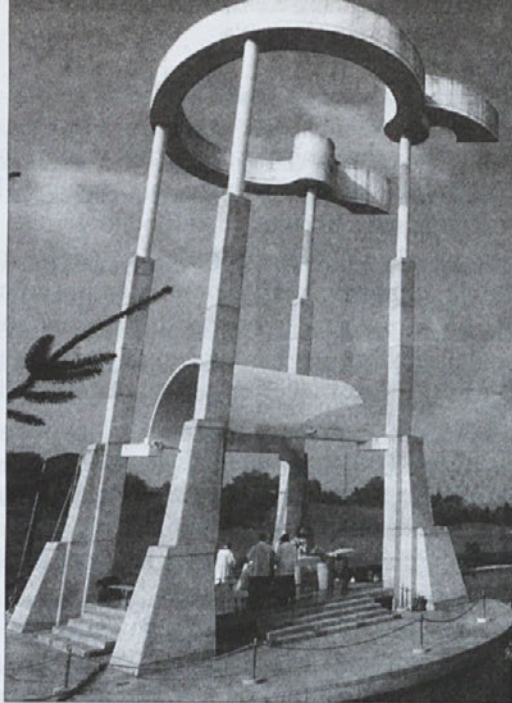
Spomin na povojne poboje na tehارج