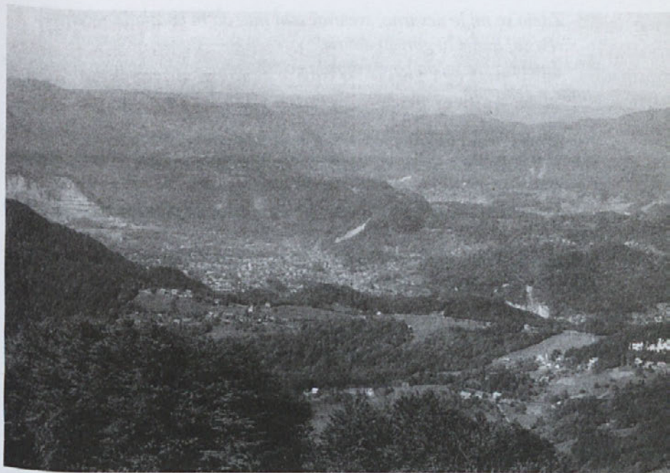
Mrzla planina (1120 m) v ospredju