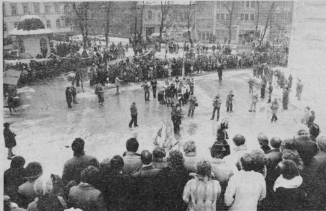
Dopoldanski folklorni del, ki je bil na Titovem trgu si je letos ogledalo nekoliko manj ljudi kot prejšnja leta.