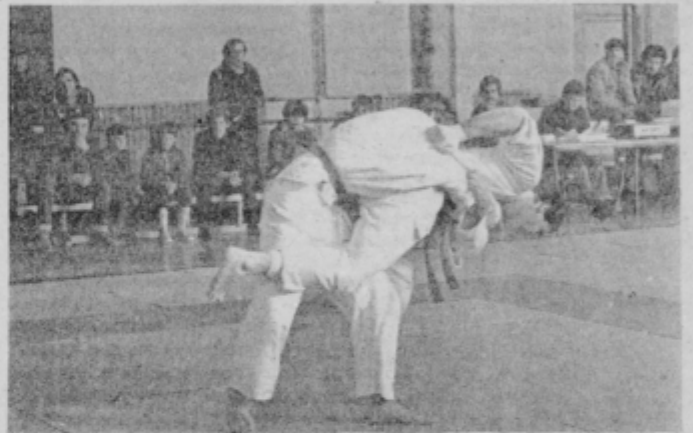
Murko (desno) je trenutno najboljši tekmovalec JK Drava

V prejšnjem tednu (torek) so člani judo kluba Drava v Mladiki izvedli prvenstvo podravskega regijskega centra. Najboljši s tega tekmovalca (med njimi je bilo največ tekmovalcev Impola iz Slovenske Bistrice) pa so se v soboto v Mariboru že udeležili republiškega prvenstva.