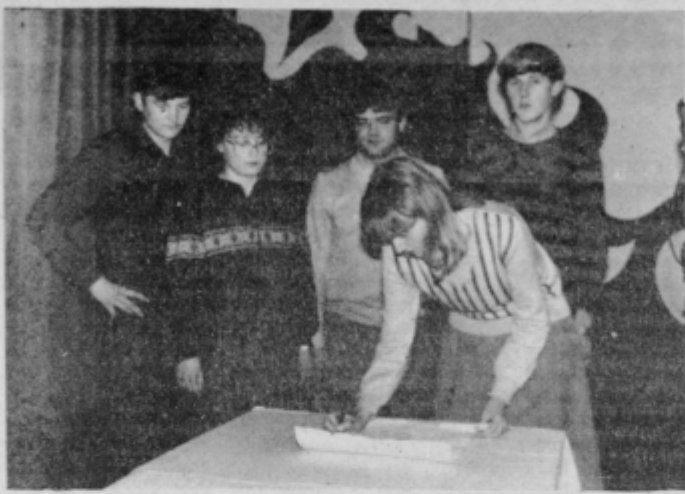
Predstavniki sodelujočih osnovnih organizacij med podpisom listine.

na našo pobudo. Sicer pa je sodelovanje med vojaki in mladino iz Ptuja in okoliških krajev že tradicionalno dobro. Podpis listine o sodelovanju je izrednega pomena za nadaljnje sodelovanje in krep-