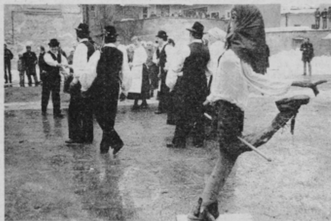
»Pustna baba«, ki jo je predstavila folklorna skupina Oljka iz Smartnega ob Paki.

Domači peki so jih spekli zelo malo, niso zadovoljni s ceno; prodajati bi jih morali po 10 dinarjev. Ptujski gostinci so imeli enotno ceno 12 dinarjev nekaj