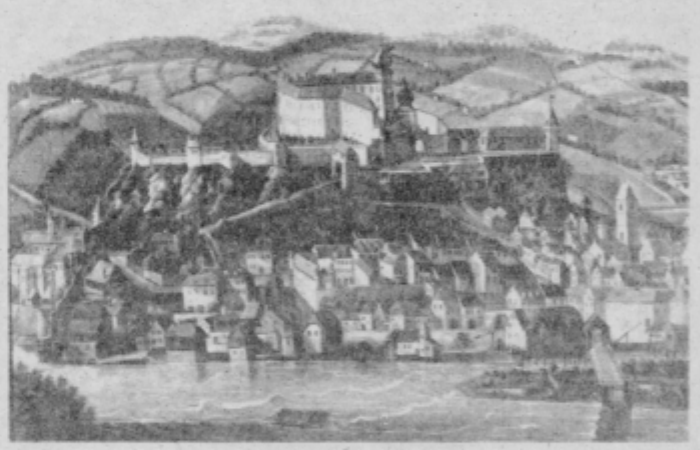
Neznani slikar: Ptuj, 1687. Slika hrani PMP pod inv. št. G 829 s. Fototeka kulturnozgodovinskega oddelka. Foto Srečko Habič, 1969.

ime za stavbe na grajskem griču. Tudi sicer je grajski kompleks v središču slikarjeve pozornosti. Dobil je kompozicionalno pretehtano mesto, na grajskih stavbah se je zbralo največ svetlobnih poudarkov, stavbe pa so v primerjavi z mestnimi hišami tudi nekoliko predimenzionirane.