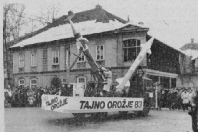
Američani in Rusi z raketami, mi pa kar s fračo.