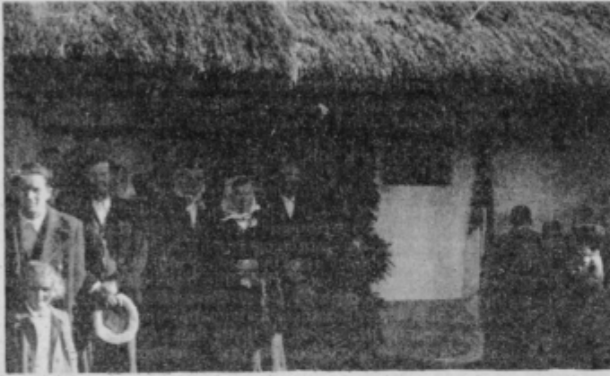
Odkritje spominske plošče na Murkovi domačiji v Drstelji, 19. oktobra 1952.

Radikalno spremembo v dotedanjih slovenski etnološki misli pa