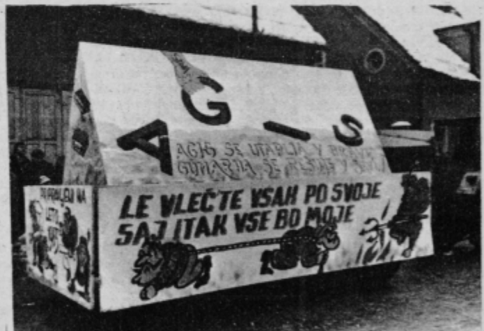
Tudi v nedeljskem karnevalskem sprevedu so „obdelali“ izločitev Gumarne iz Agisa. Za lažje branje: zanimiv je nekoliko slabše vidljiv zapis Agis se utplja v Dravi, Gumarna se rešuje v Savi!