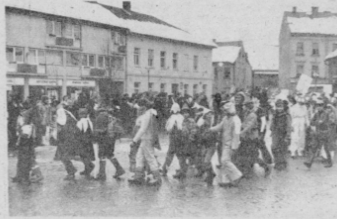
Učenci OŠ Tone Žnidarič so v nedeljo sodelovali v karnevalskem delu in dobili posebno nagrado za izvirnost in množičnost.