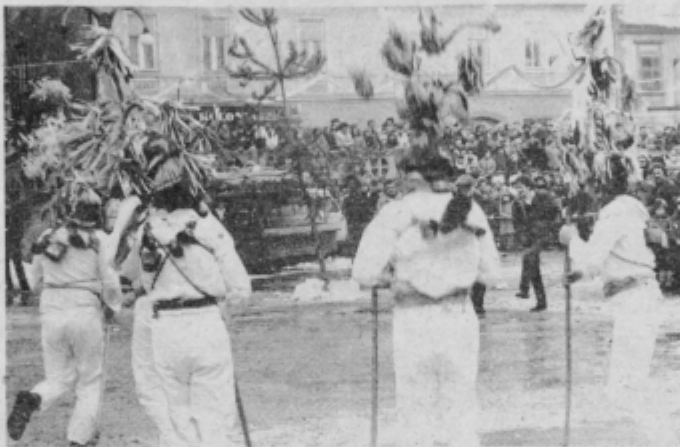
Blumarji iz Beneške Slovenije

Lepo je bilo videti, da so te skupine mlade in so torej porok, da bo izročilo naših prednikov še živelo, pa čeprav samo skozi kurentovanje oziroma podobne prireditve. Blumarji, znani po pisanih svojevrstno oblikovanih kapah, so povedali, da so ponovno