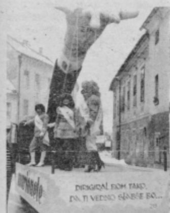
Prvo nagrado v karnevalskem delu je dobila skupina MIP »Marionete« ali po domače lutke.