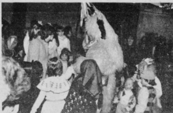
Male maske so razveselili s svojim obiskom tudi karenti.