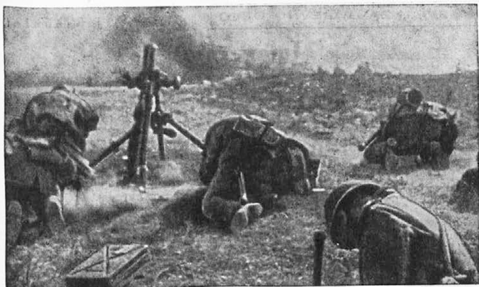
»Kuge, lakote in vojske — reši nas o Gospod!»

prava za brezbožen materializem in komunizem. Brez delovanja lož si težko moremo misliti, kako je mogla evropska meščanska družba tako daleč dozoreti za komunistično revolucijo.