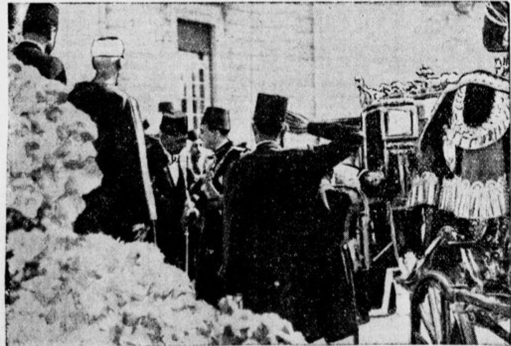
Mladi egiptovski kralj Faruk prihaja k začetnemu zasedanju egiptovskega parlamenta.