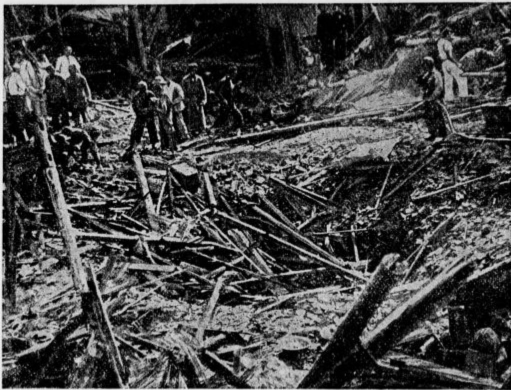
Japonske bombe padajo na mesto Nanking ter prizadevajo veliko škodo.