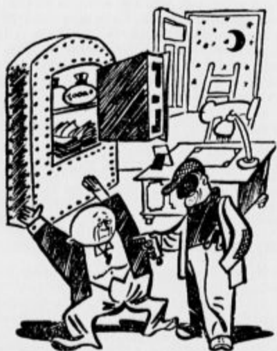
»Le mirni bodite! Če boste tiho, vam ne bom skrivil lasu!«

Tamkaj je na strehi gnezdila štorcklja. Ker pa so morali hišo popravljati, so morali seveda štorcklino gnezdo vzeti s strehe, kjer je bilo že toliko let. Ko pa so kroveci hoteli gnezdo kar dvigniti, so videli, da ga ne morejo nikamor pre-makniti, ker je pretežko. Zato so morali gnezdo razdejeti ter ga kos za kosom metati na tla. Spo-daj so potem kose gnezda položili na tehtnico ter tako dognali, da je vse gnezdo tehtalo nič manj kakor 19 stotov in 40 kg. Kolikokrat je pač štorckljev, kakor bi človek rekel samcu štorcklje, moral zleteti s strehe na tla in tam pobirati gra-divo za svoje gnezdo, preden je spravi na streho tako težo. Omeniti pa je treba, da je štorcklja vsa-ko pomlad na novo kaj doprinesla v svoje gnezdo, tako da je bilo vedno težje in težje. Prihodnjo pomlad pa bo morala ta družina štorcklje, ki je sedaj prebivala in gnezdila v tem gnezdu, zgra-diti docela novo gnezdo. Lastnik hiše, ki ima rad štorcklje, je pa živalim pustil temelj za njihovo gnezdo. Za temelj je bilo namreč staro kolo, ka-tero so znova postavili na streho, da bodo na njem štorcklje napravile novo gnezdo.